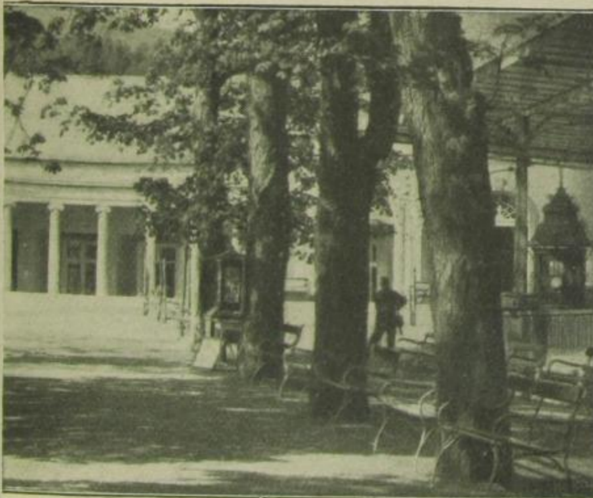
mit neuer Wandelhalle