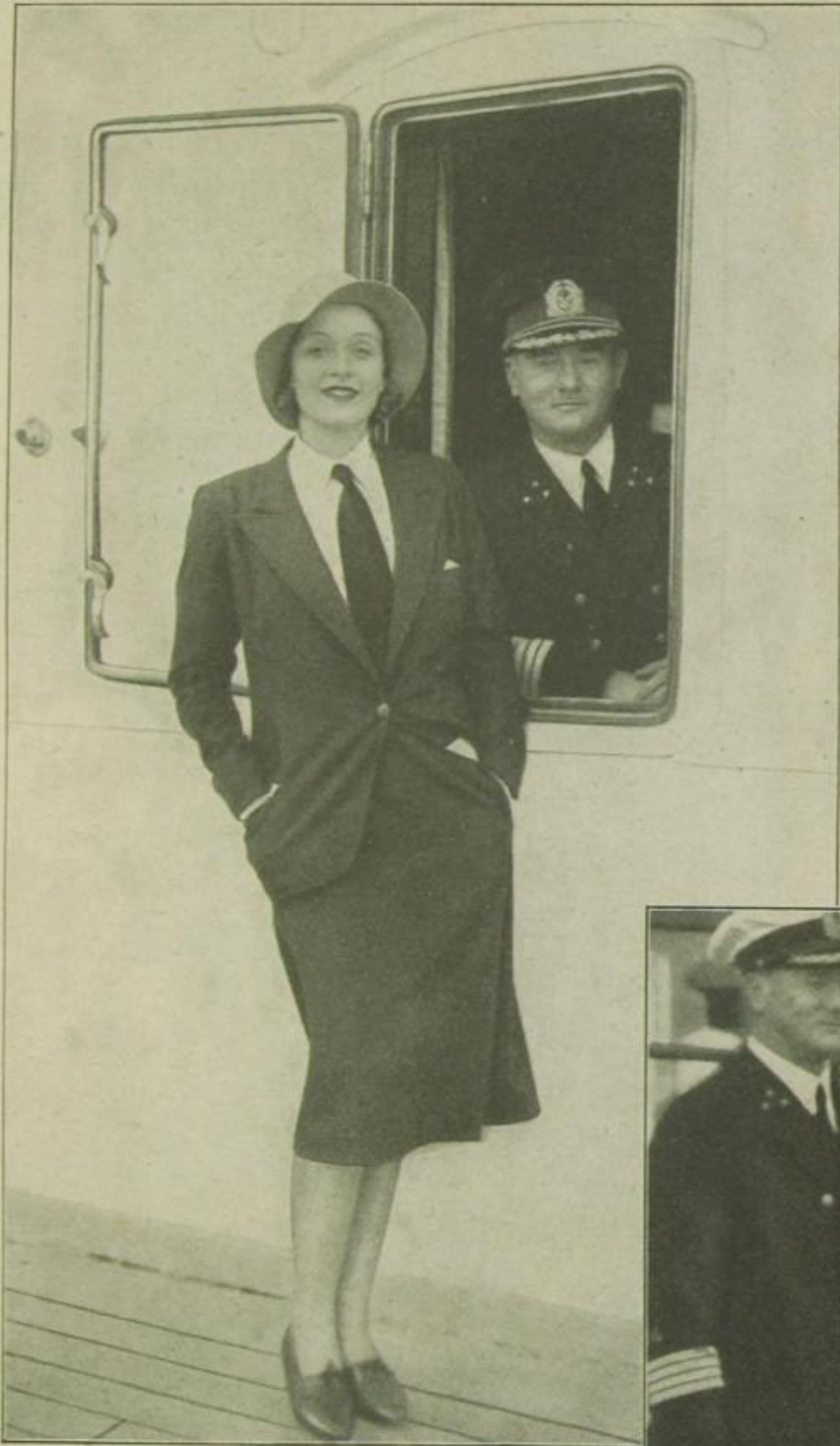
Kapitän Ziegenbein und — Marlene Dietrich

Einer kennt sie: der „Käppen“ Ziegenbein. Kein Prominenter tut eine Reise auf seinem Schiff, ohne sich nicht zum Andenken