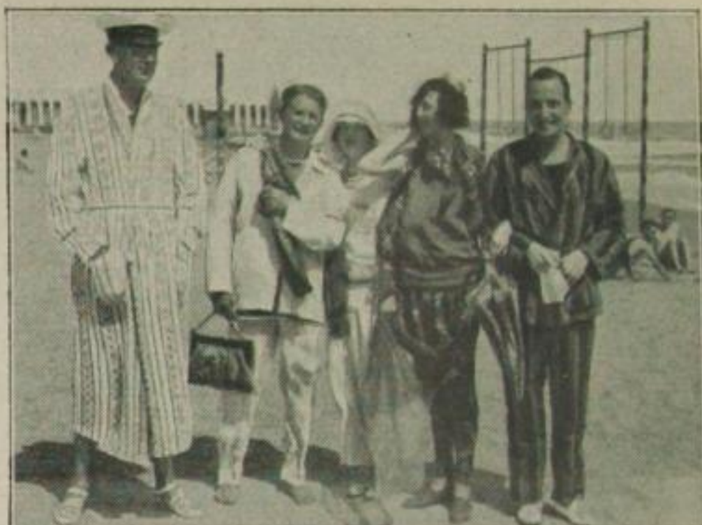
Am Strand des Hotel Excelsior am Lido