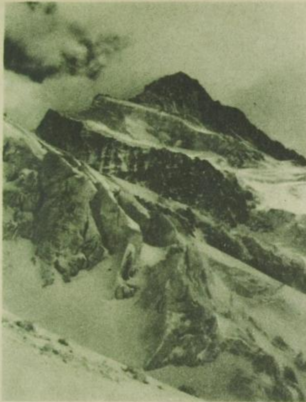
Eisriesen im Berner Oberland

Über blauschimmernde Gletscher und bergwärts ziehende Schutthalden ragt kahl und grau, ein schweigsam steiner- ner Gigant, ehern der Fels