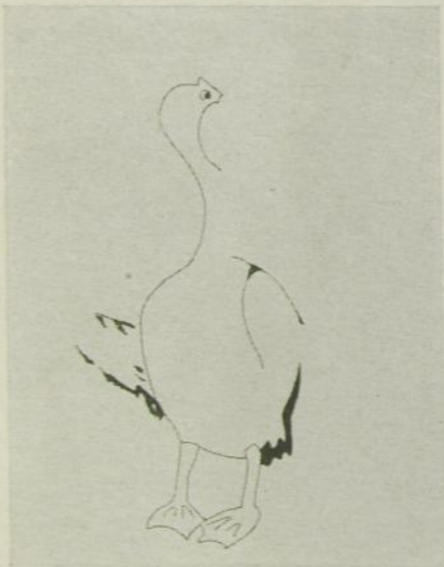
3. Siehste, jetzt ist's schon ein Mann,