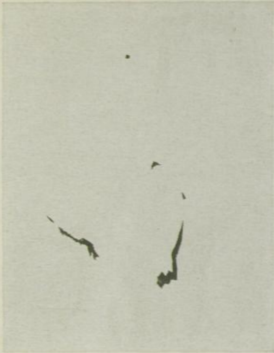
1. Erst wird Tinte hingekleckst