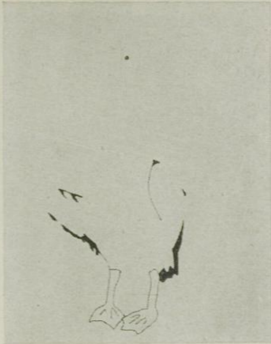
2. Dann zwei Beine zugehext