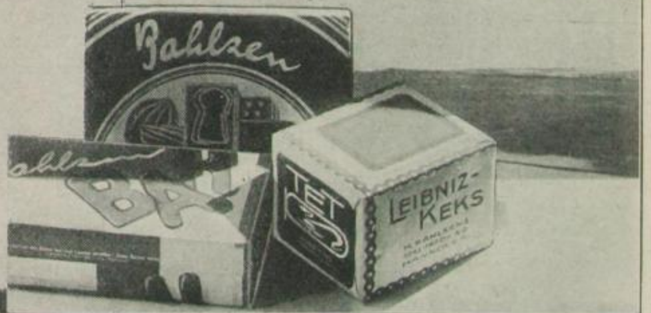
Kekse aus Hannover