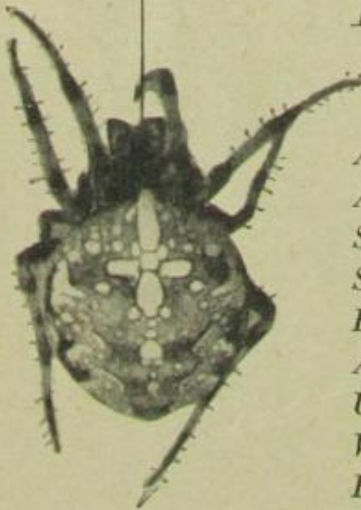
Die Spinne, die Erfinderin des Jo-Jo

Fräulein Margot wird verlangt, Fräulein Margot wird verlangt Auf Zimmer dreißig, Auf Zimmer achtzig. Sie ist sehr fleißig, Sie macht sich. Fräulein Margot wird verlangt, Auf Zimmer eins bis hundert, Und fragen Sie verwundert: Wieso? Wieso? Wieso? Fräulein Margot spielt perfekt Jo-Jo.