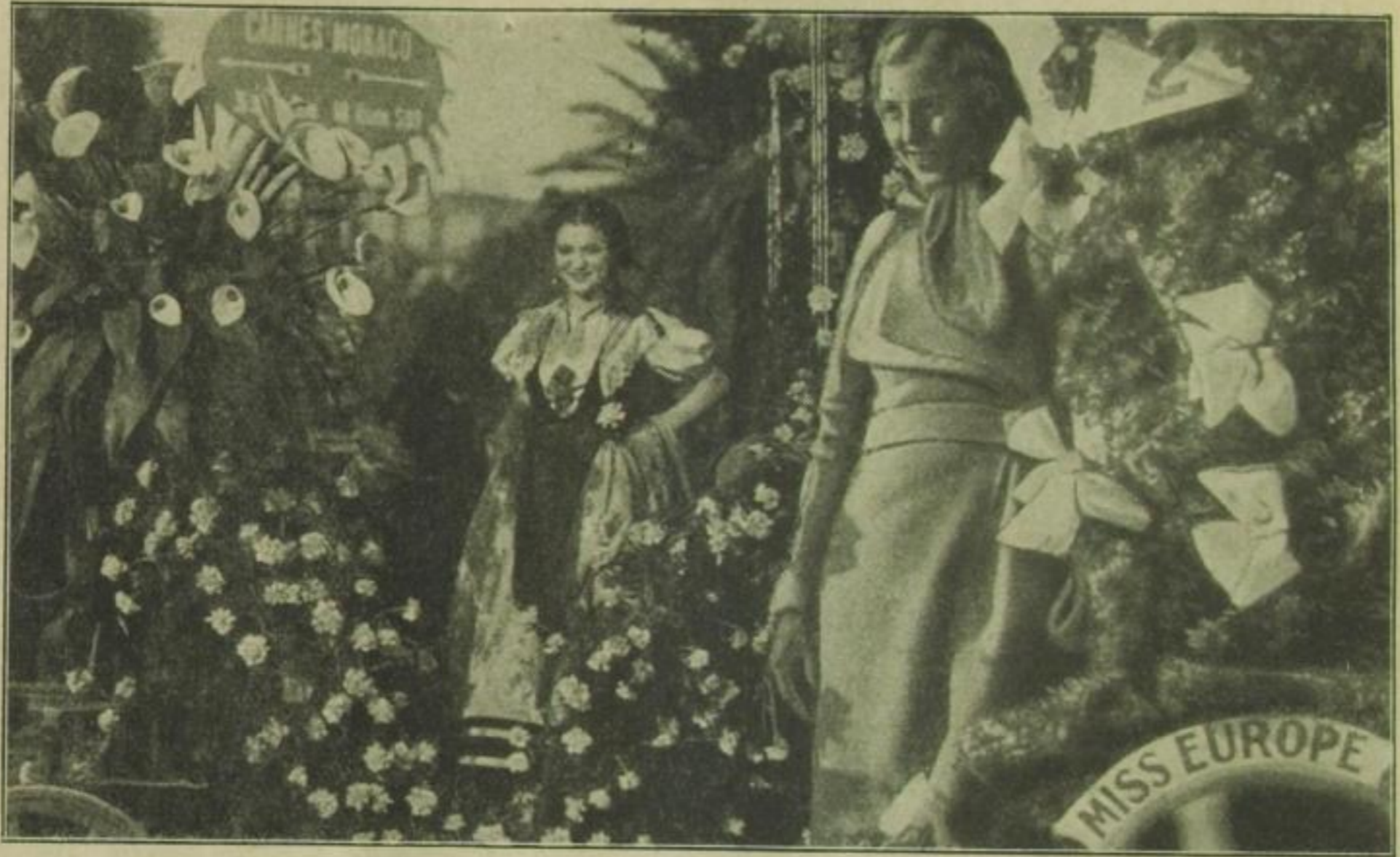
Der Blumenkorso in Cannes stellt den Höhepunkt der alljährlichen Faschingsumzüge dar („Miß Cannes“ und „Miß Europa“)