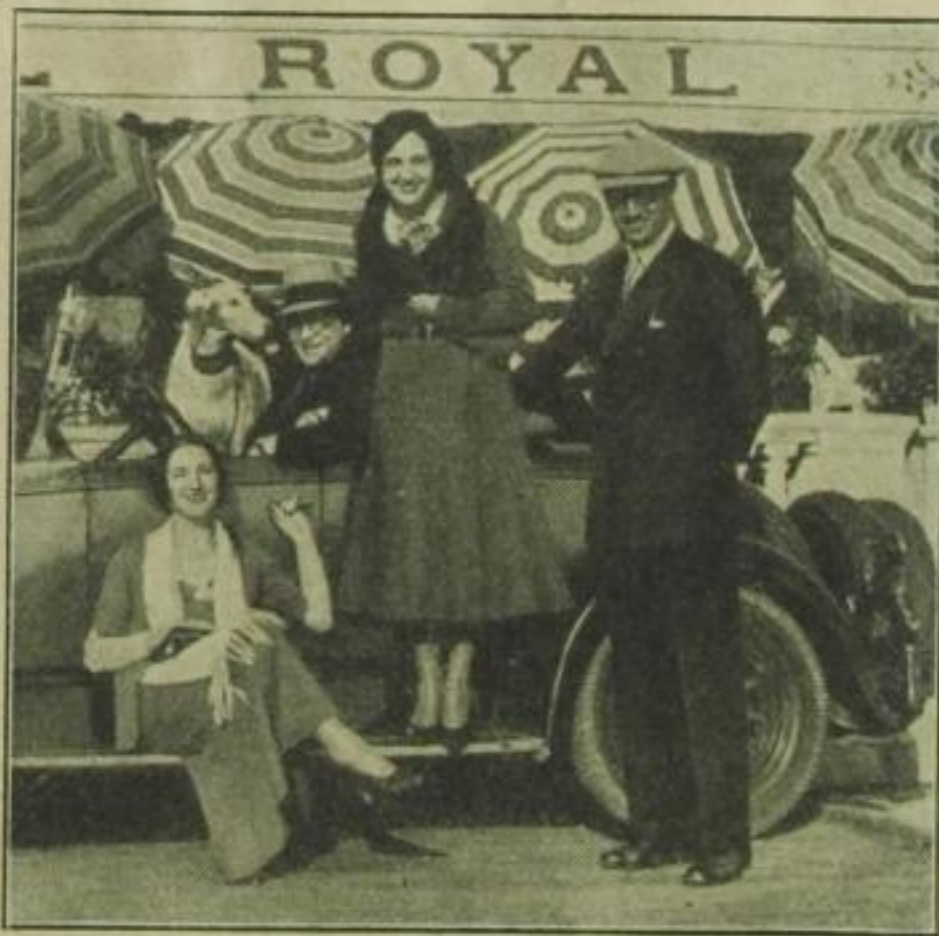
Vom Auto aus sieht man dem fröhlichen Trubel auf der Promenade des Anglais in Nizza zu

Der Februar, das ist die schönste Zeit der Riviera, die Zeit der Mimosen und Veilchen und der schönen Frauen. Wenn bei uns die Gärten kahl sind, ranken sich dort unten blühende Kletterpflanzen an Mauern und Häusern hoch.