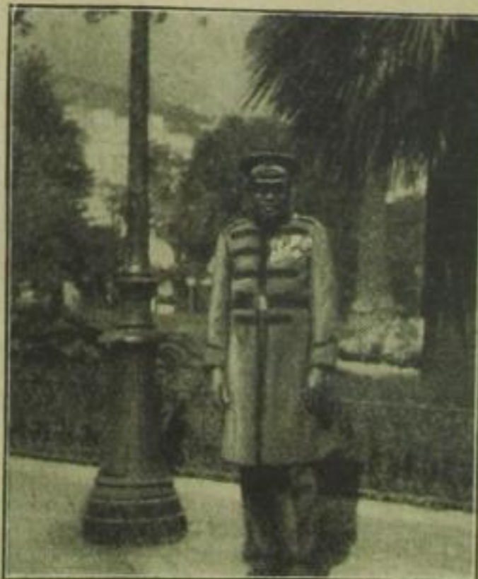
Hotel de Paris, ein Senegalneger

Wenn hier die Frauen in warme Pelze schlüpfen, sozusagen ihre Winterhaut angezogen haben, beherrscht dort das weiße Kleid das Bild des Tages. Stundenlang liegt man auf hohen Felsen über blauem Meere und läßt sich