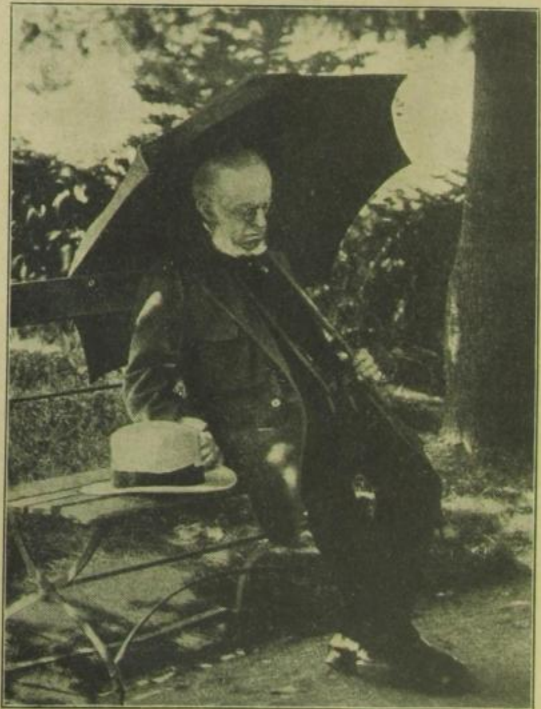
Kommt Ihnen der alte Herr auch irgendwie bekannt vor? Wir wollen es Ihnen verraten: Adolf Menzel macht sein Mittagsschläfchen im Tiergarten