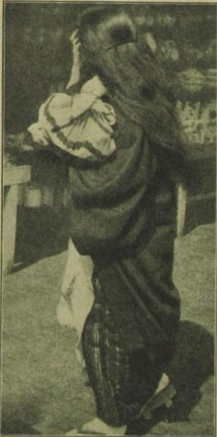
Unter den Geishas gilt es als besonders schick, sich nach der Haarwäsche mit offenem Haar auf der Straße zu zeigen