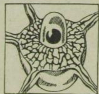
Nervenzelle nach Gebrauch von Biocitin.