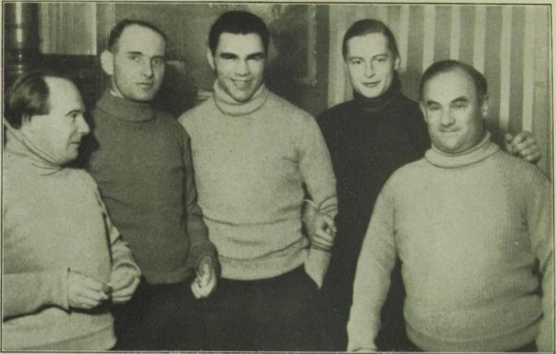
Fünf Prominente auf einem Bild