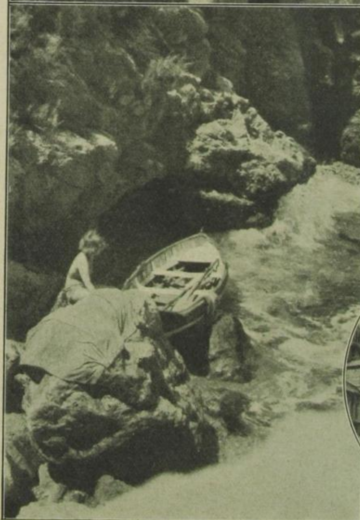
Die Bucht der Sirene (Bad der Giovanna bei Sorrento)