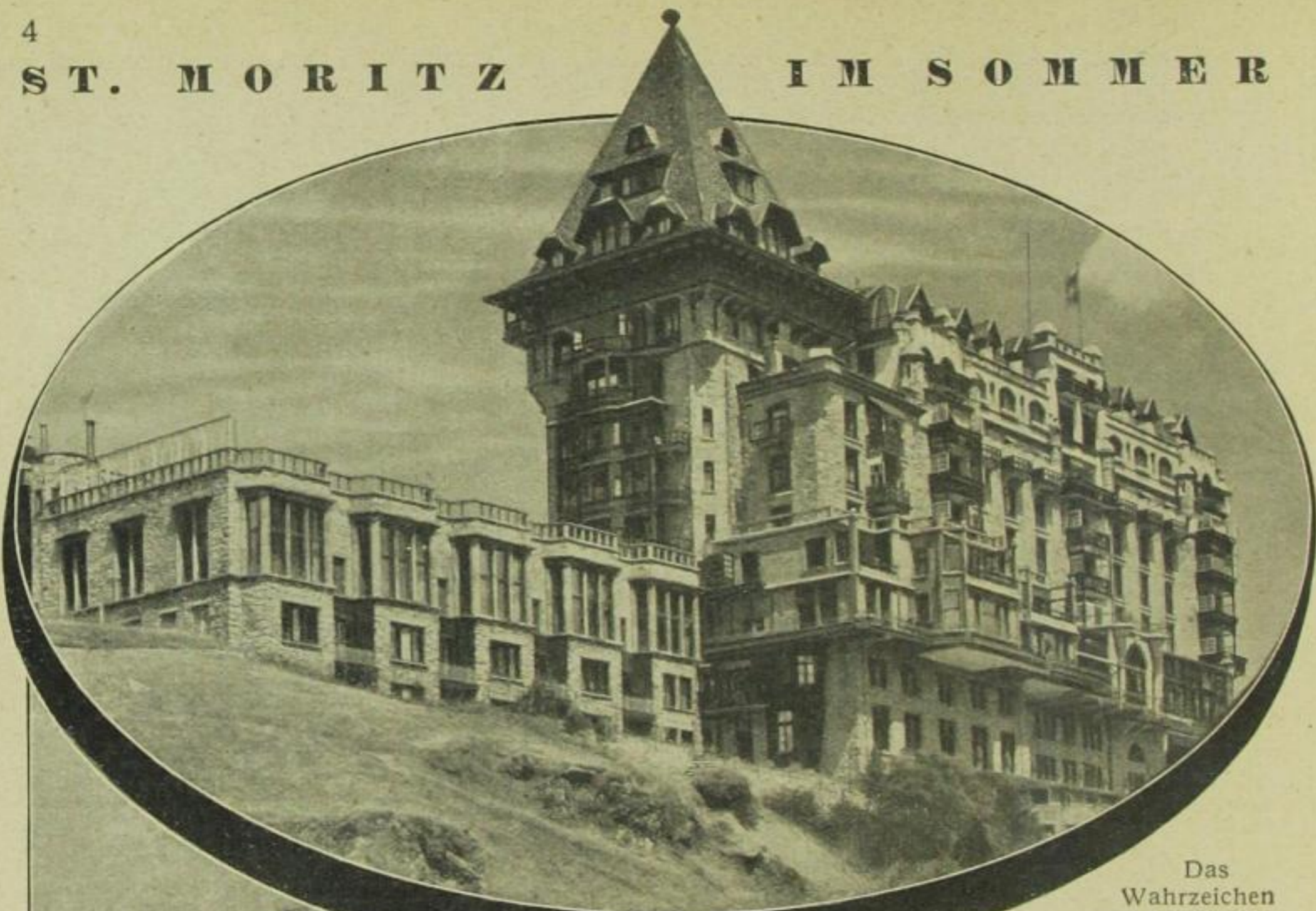
Das Wahrzeichen von St. Moritz: Das „Palace“