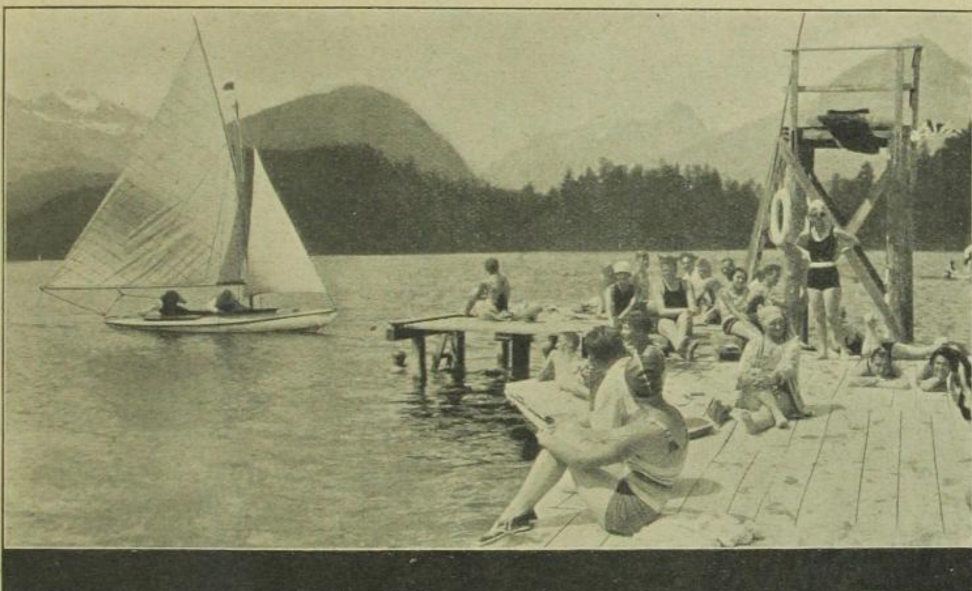
Baden und Segeln

ischen Länder ein Rendezvous gibt, sind weltbekannt. Hans Badrutt, der Inhaber des Palace-Hotels, ist einer der führenden Sportsleute und hat es verstanden, die Champions des internationalen Sports im Palace-Hotel zu konzentrieren.