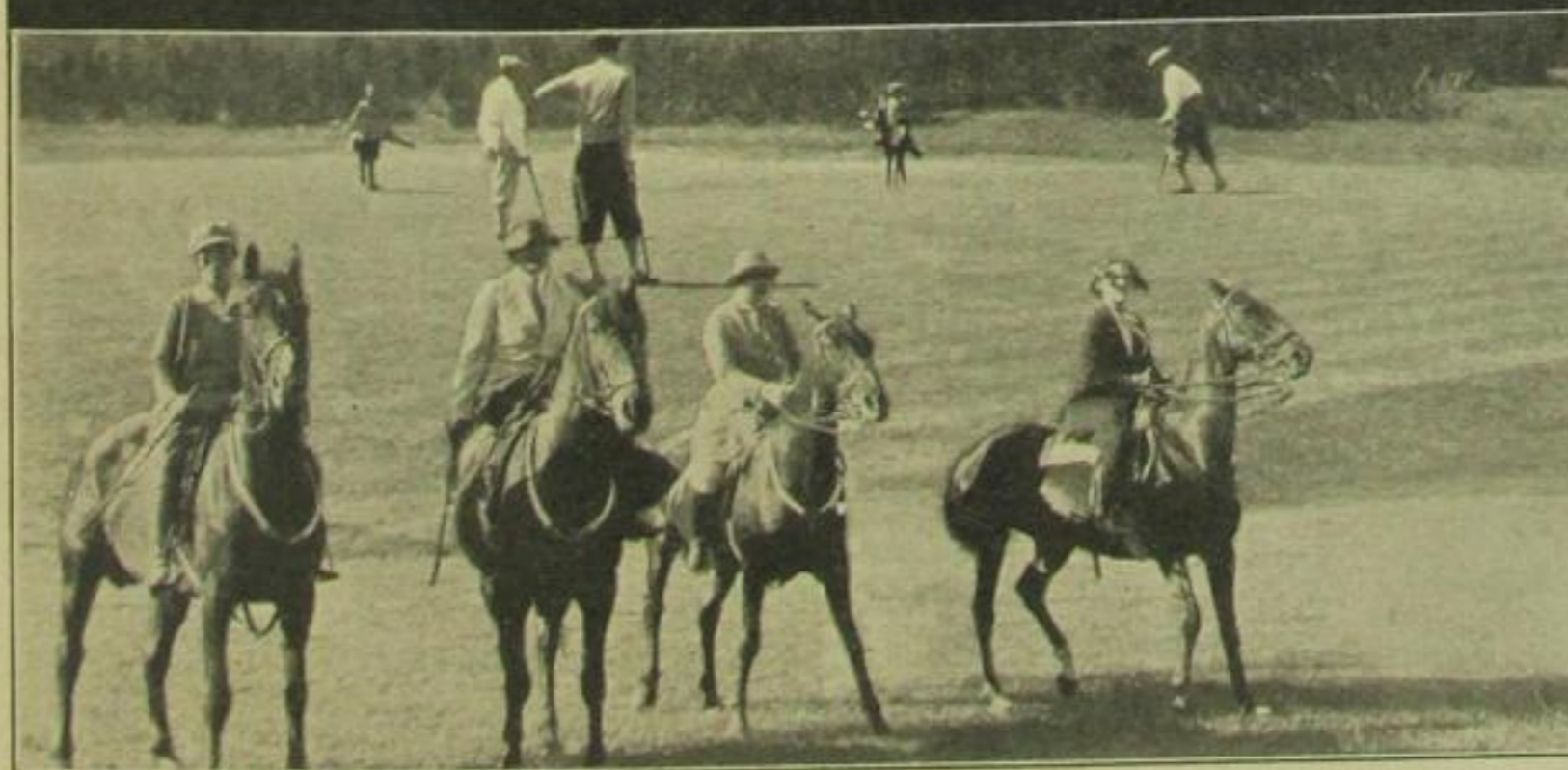
Golf und Pferderennen