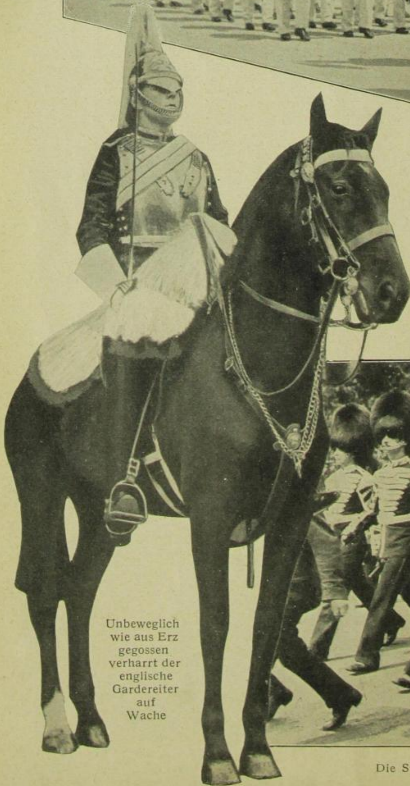
Unbeweglich wie aus Erz gegossen verharret der englische Gardereiter auf Wache

Die prächtigen Uniformen der englischen Garde mit den typischen Bärenmützen