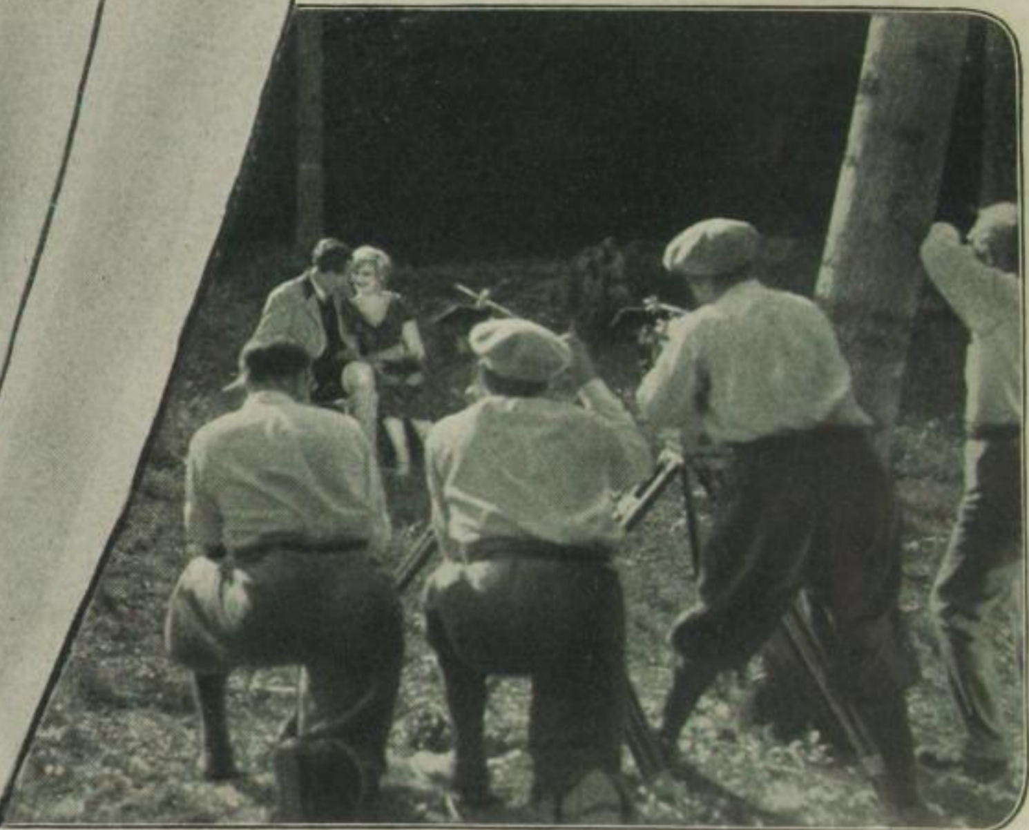
Das „traute“ Stelldichein im Walde

verstandenen Sinne Echtheit verlangt. Es gab eine gewisse Empörung, als man hörte, daß ein in der Wüste spielender Film in Wahrheit in dem Dünensand der kalifornischen Küste aufgenommen war. Man war auch nahe daran, einem Helden-schauspieler alle Qualitäten eines Helden abzusprechen, weil sich herausstellte, daß er sich in einem tollkühnen, zur Rettung der Geliebten unternommenen Ritt durch ein „Double“ hatte vertreten lassen. Ganz zu schweigen von dem Sprung über den