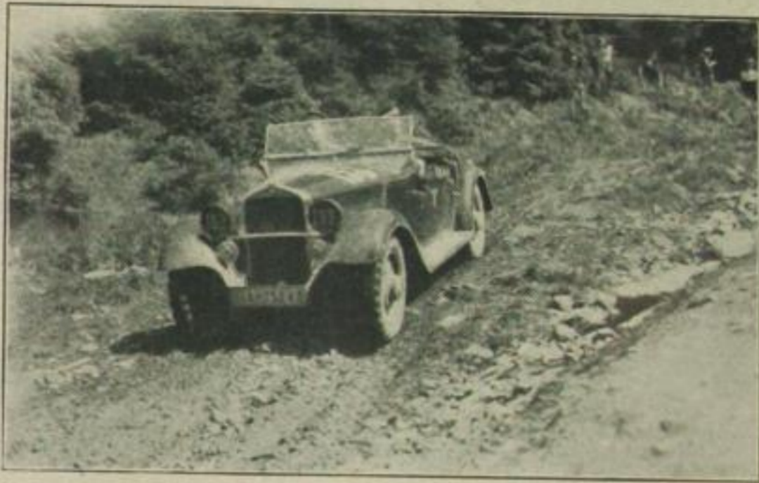
Bei der Dreitage-Harzfahrt, Deutschlands schwerster Geländeprüfung, hat MERCEDES-BENZ Schwingachstyp „200“ über Geröll und Wiesenhänge, Berge und Sümpfe einen einzigartigen Rekorderfolg davongetragen

Wer die Wahl hat, hat die Qual: Aus allen Zeitungen schreit es, alle Vertreter deklamieren es: Es gibt keinen besseren Wagen! Und der zum Automobilbesitzer avancierende Sterbliche fragt sich voll Entsetzen, wo nun eigentlich die Reklame aufhört und die