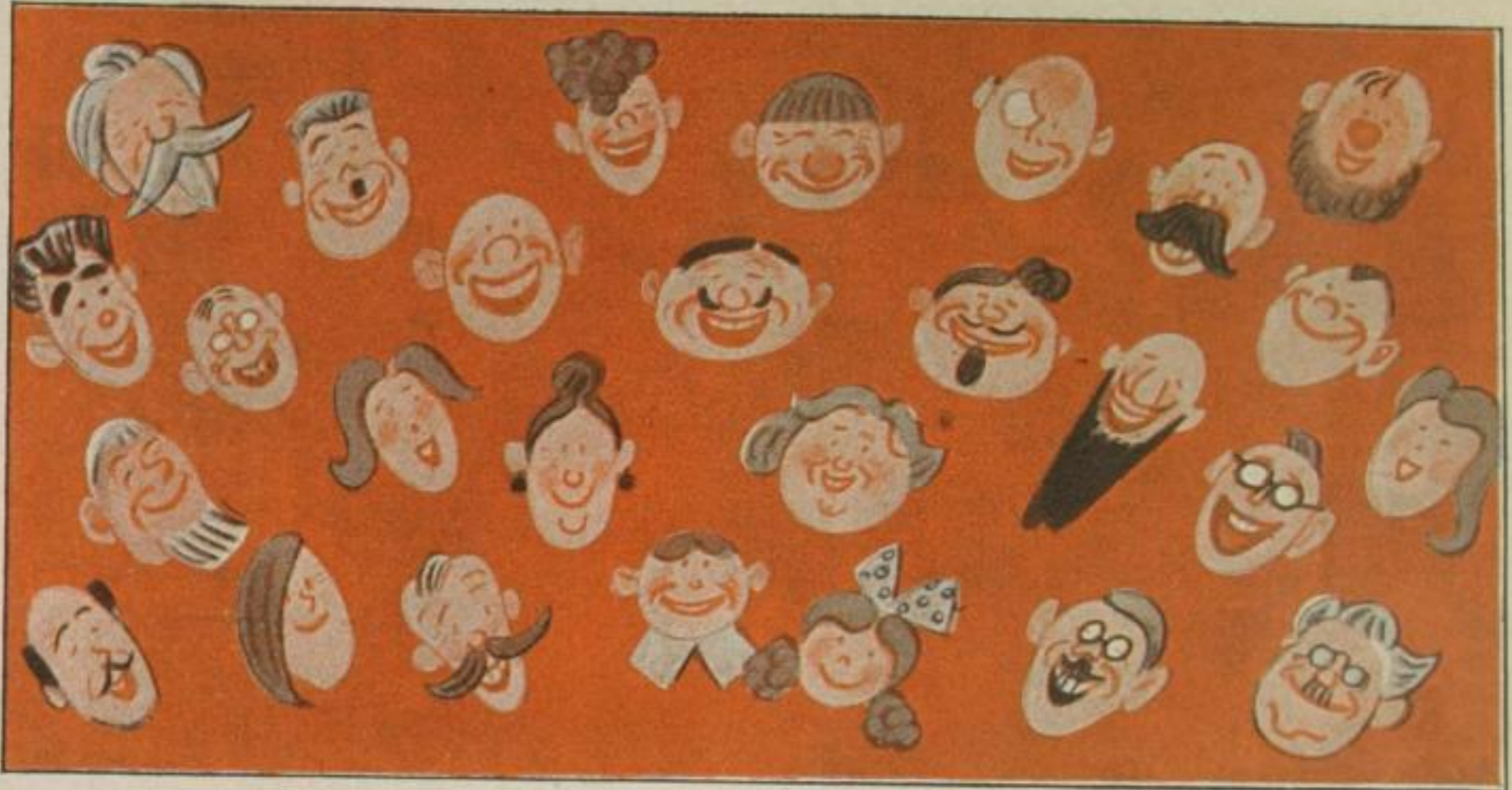
Prospekt eines Komikers

künstlers, wie selbstverständlich die karikierte Akrobatentruppe, deren Pyramide die Folie für die an der Rampe arbeitenden Artisten gibt.