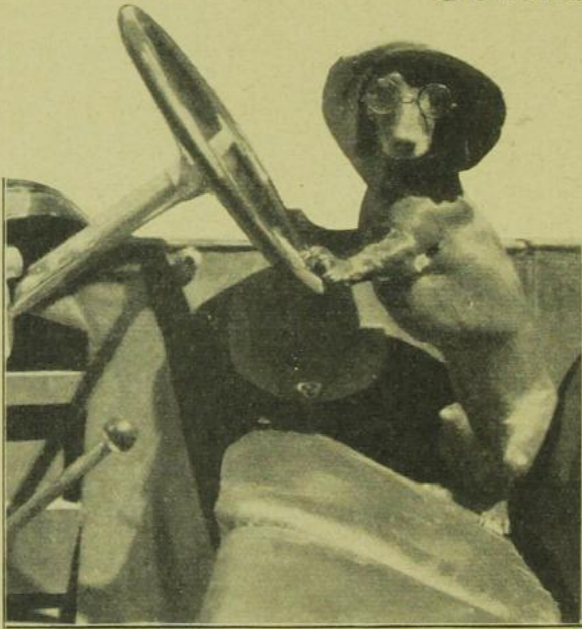
Watschelmann, der kleine Herrenfahrer