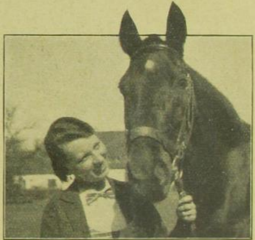
„Ob du mich herunterwerfen wirst?“