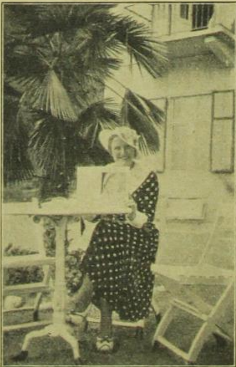
Eine treue Magazinfreundin im sonnigen Süden