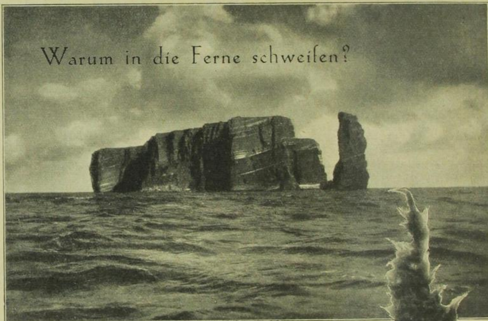
Bilder aus dem schönen Deutschland