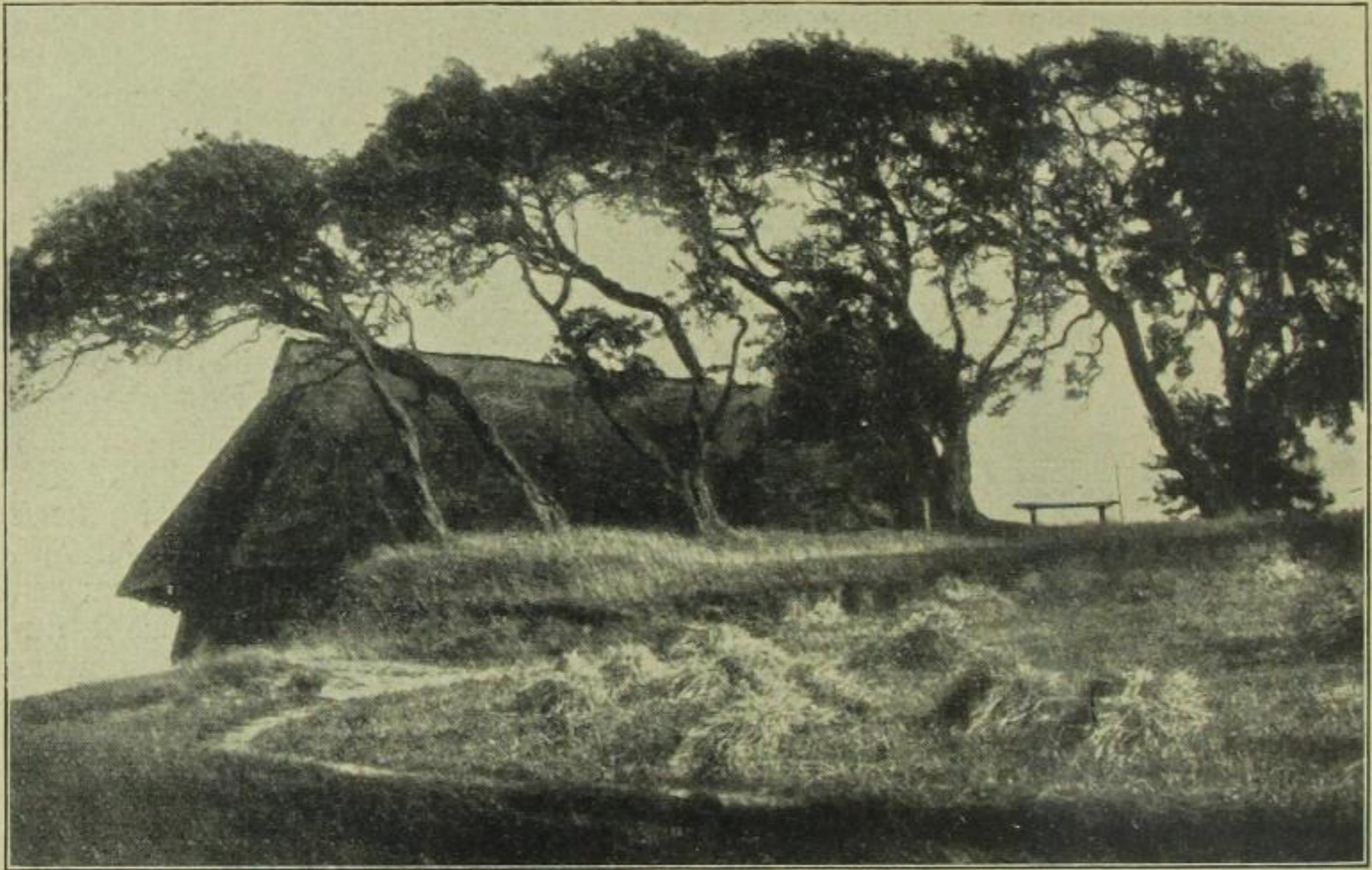
Am Rande des Dars in Pommern

Nationaldenkmal, das feierlich und ernst zum Ruhm unvergeßlicher deutscher Tat steht ..