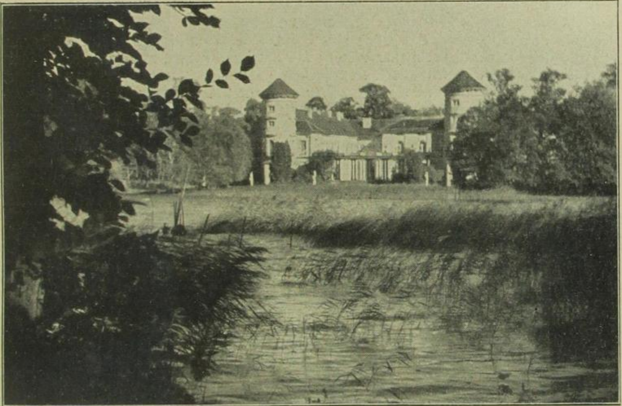
Schloß Rheinsberg in der Mark