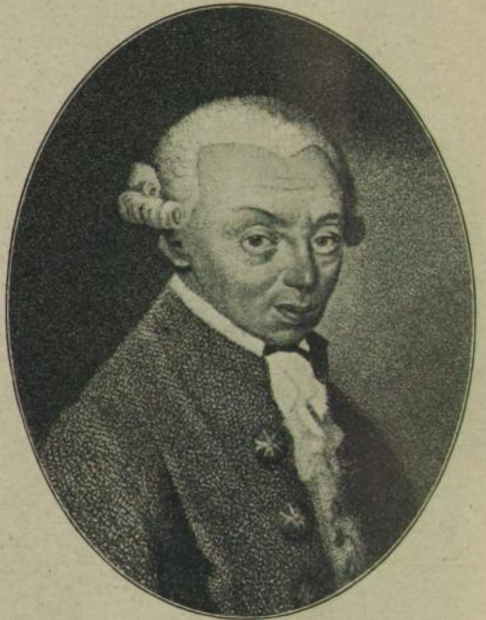
2. Immanuel Kant (1724–1804)