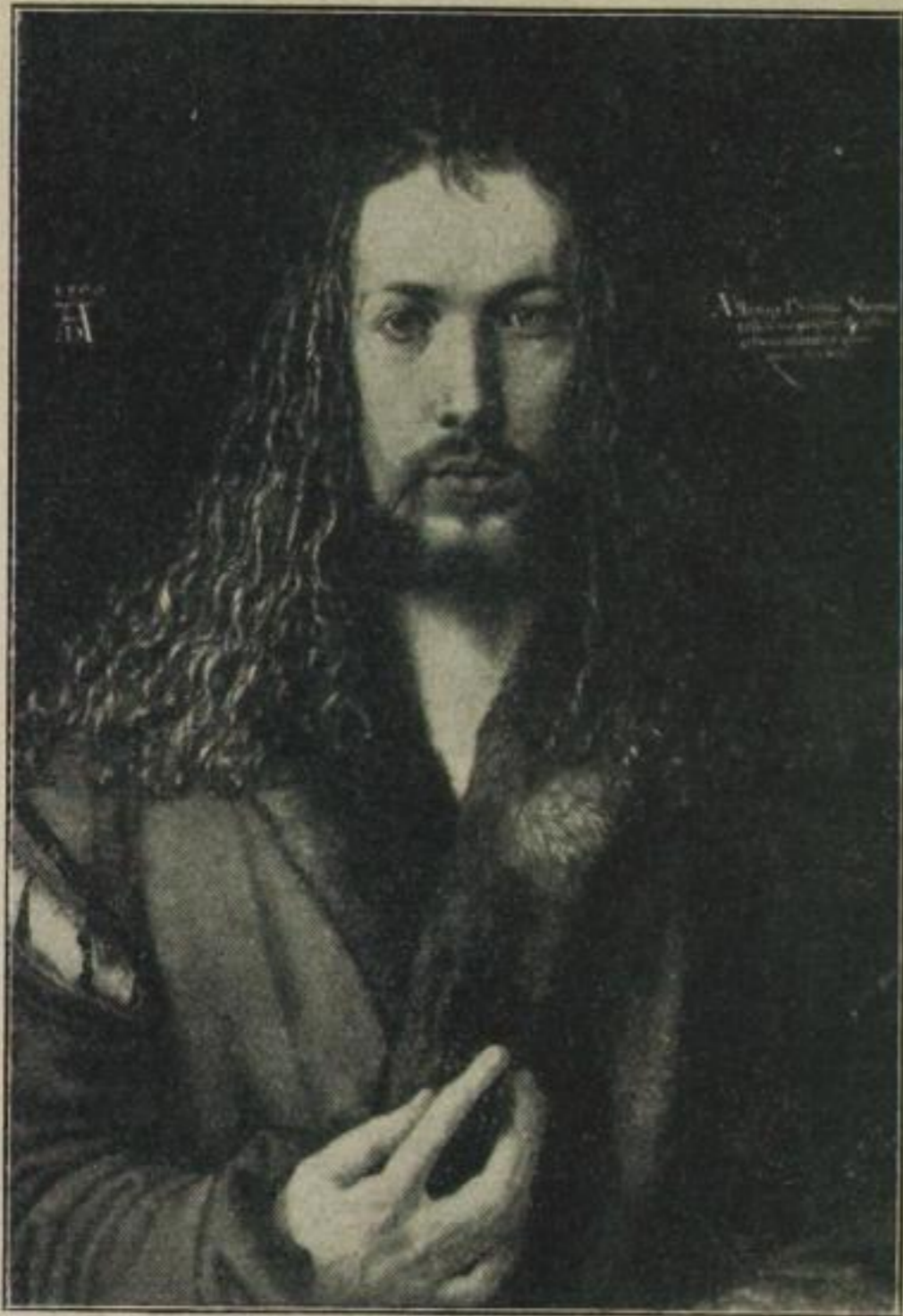
1. Albrecht Dürer (1471–1528)

(Auflösung des Fragespiels von den Seiten 24–26)