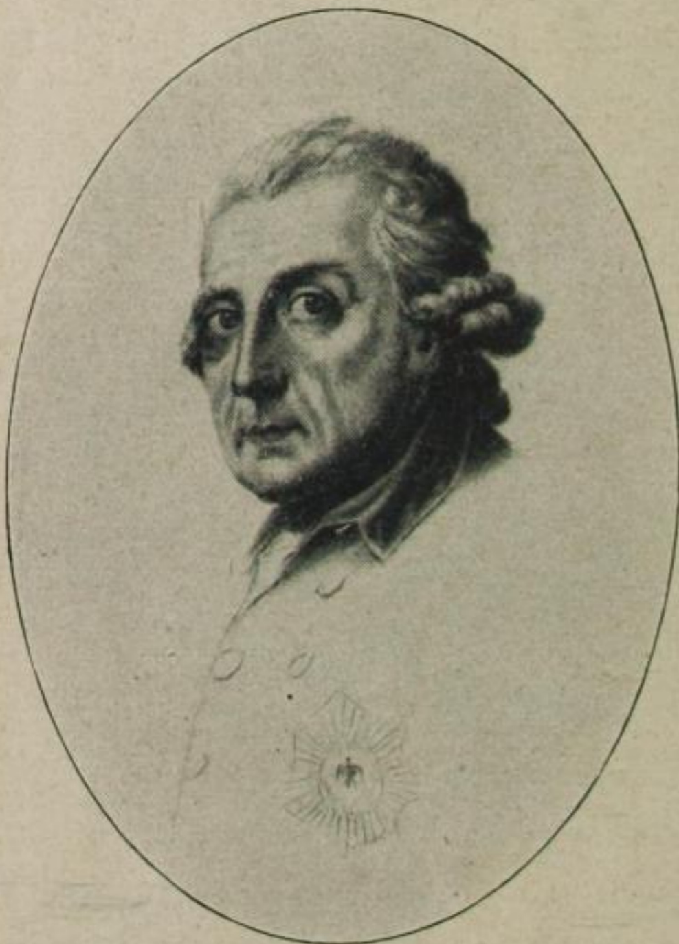
3. Friedrich der Große (1712–1786)