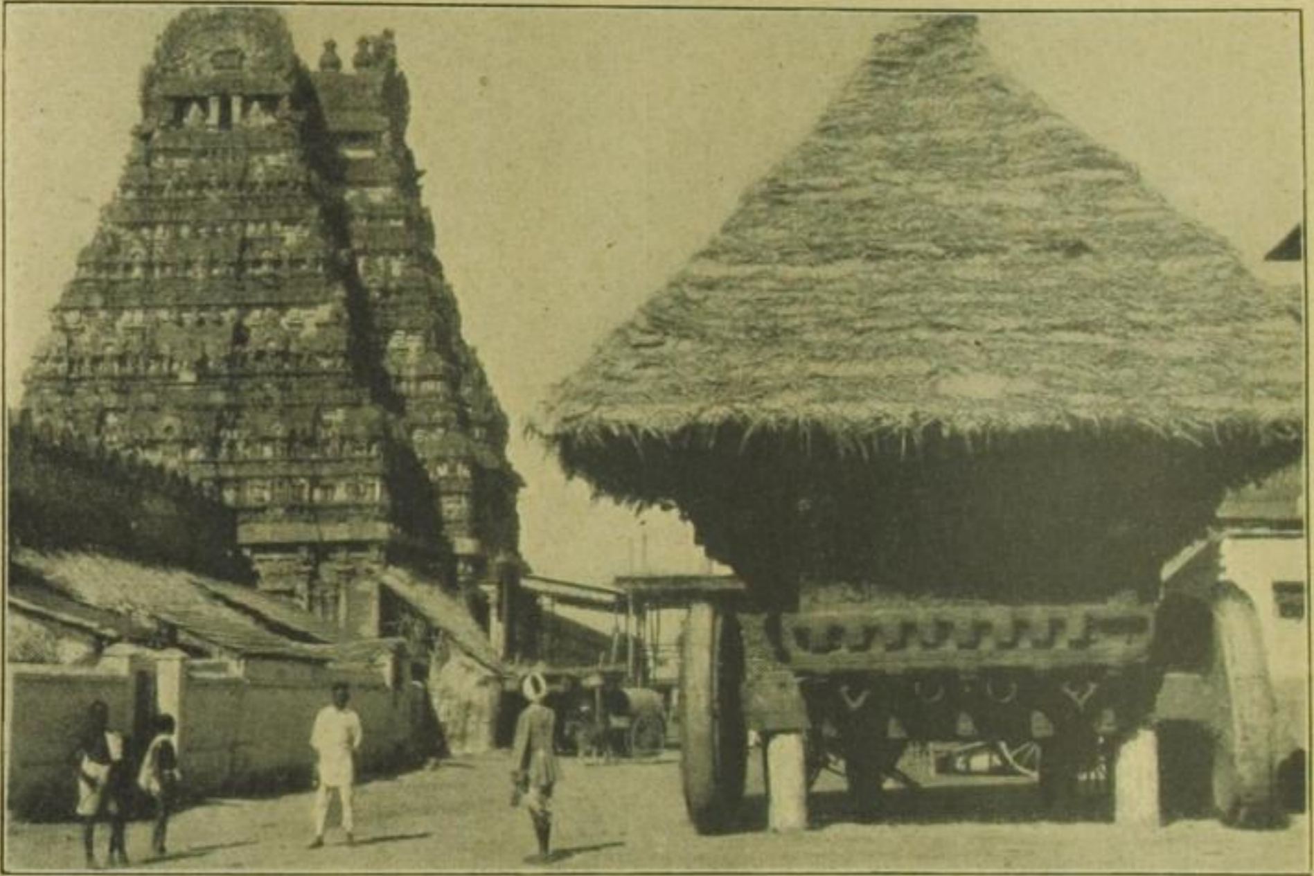
Der Leirangam-Tempel in Trichinopolz