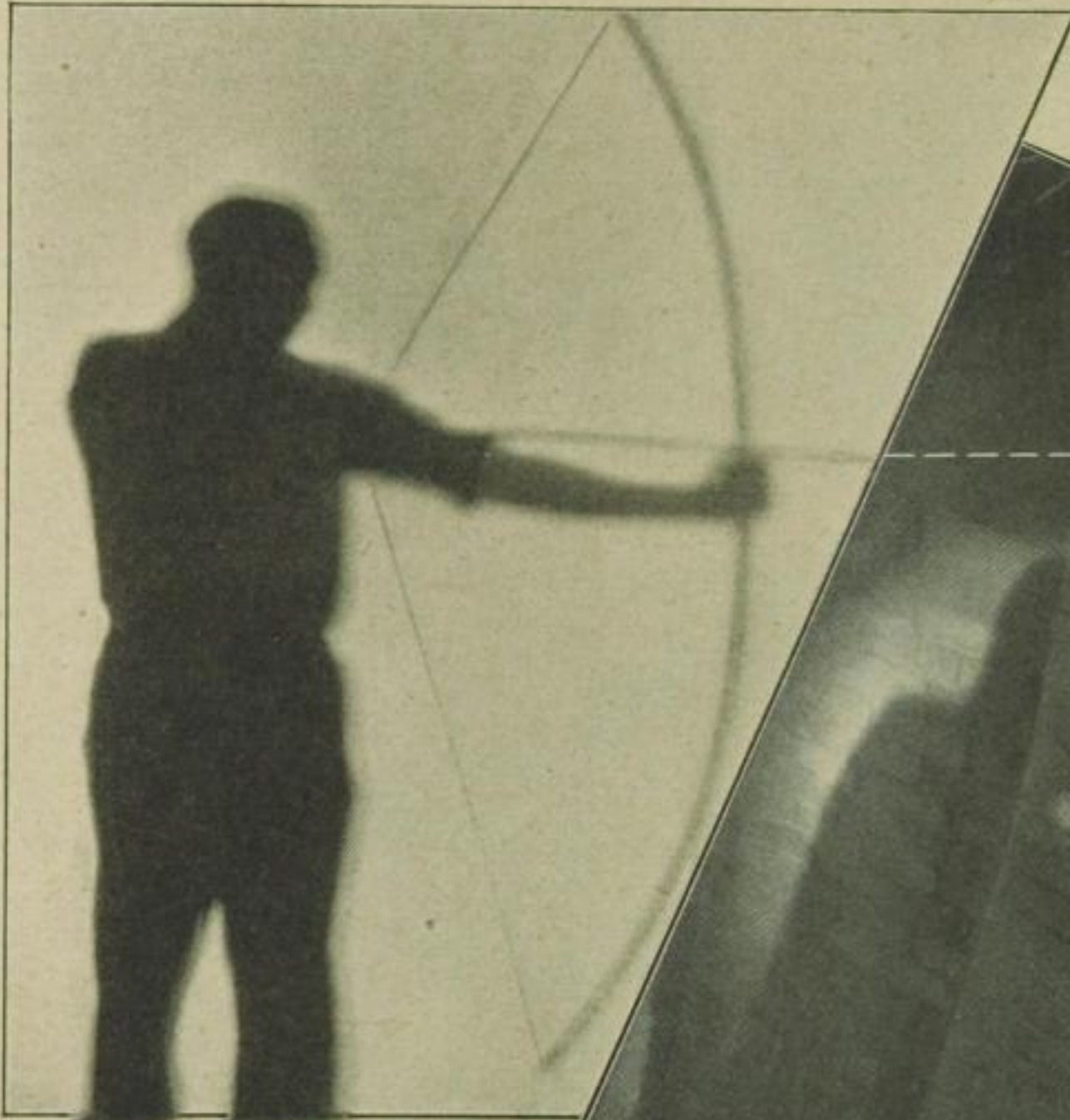
Starke Effekte erzielen gespensterhafte Schatten. Ein düsterer Kellereingang mit einer sich unheimlich hin und herbewegenden Silhouette ist überaus wirkungsvoll . . . .

vor dem ihn damals selbst eine glückliche Macht — ein Zufall bewahrt hat. Der Schatten versinnbildlicht die Tat — die Situation wird leicht verständlich, ohne viel auszusagen, ohne allzuviel zu verraten.