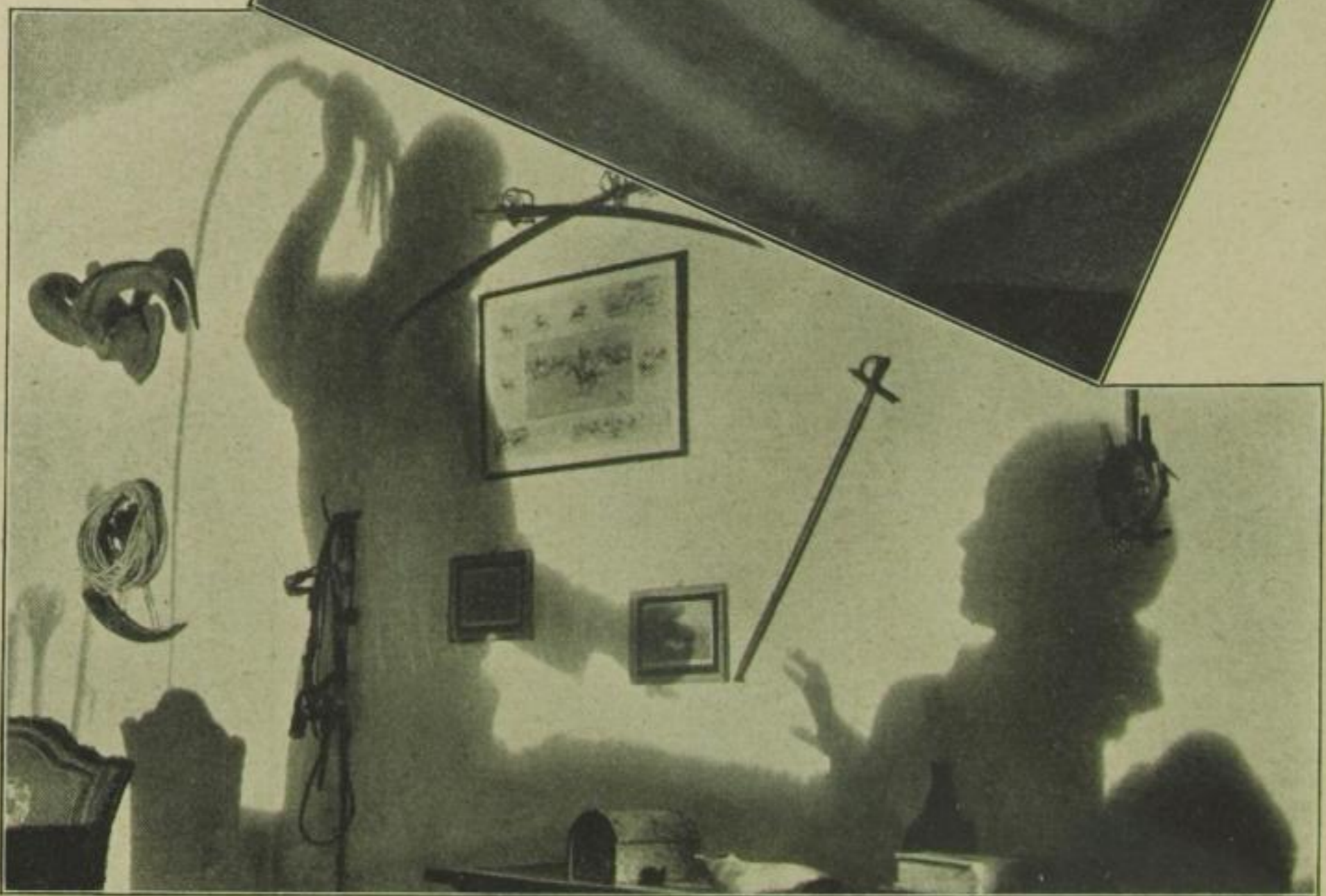
Eine brutale Handlungsweise im Film, die die Grenze überschreitet, würde keine Zensur der Welt erlauben. Ist eine solche aber unvermeidlich wegen Charakterisierung der betreffenden Person, hilft man sich durch ein Schattenspiel