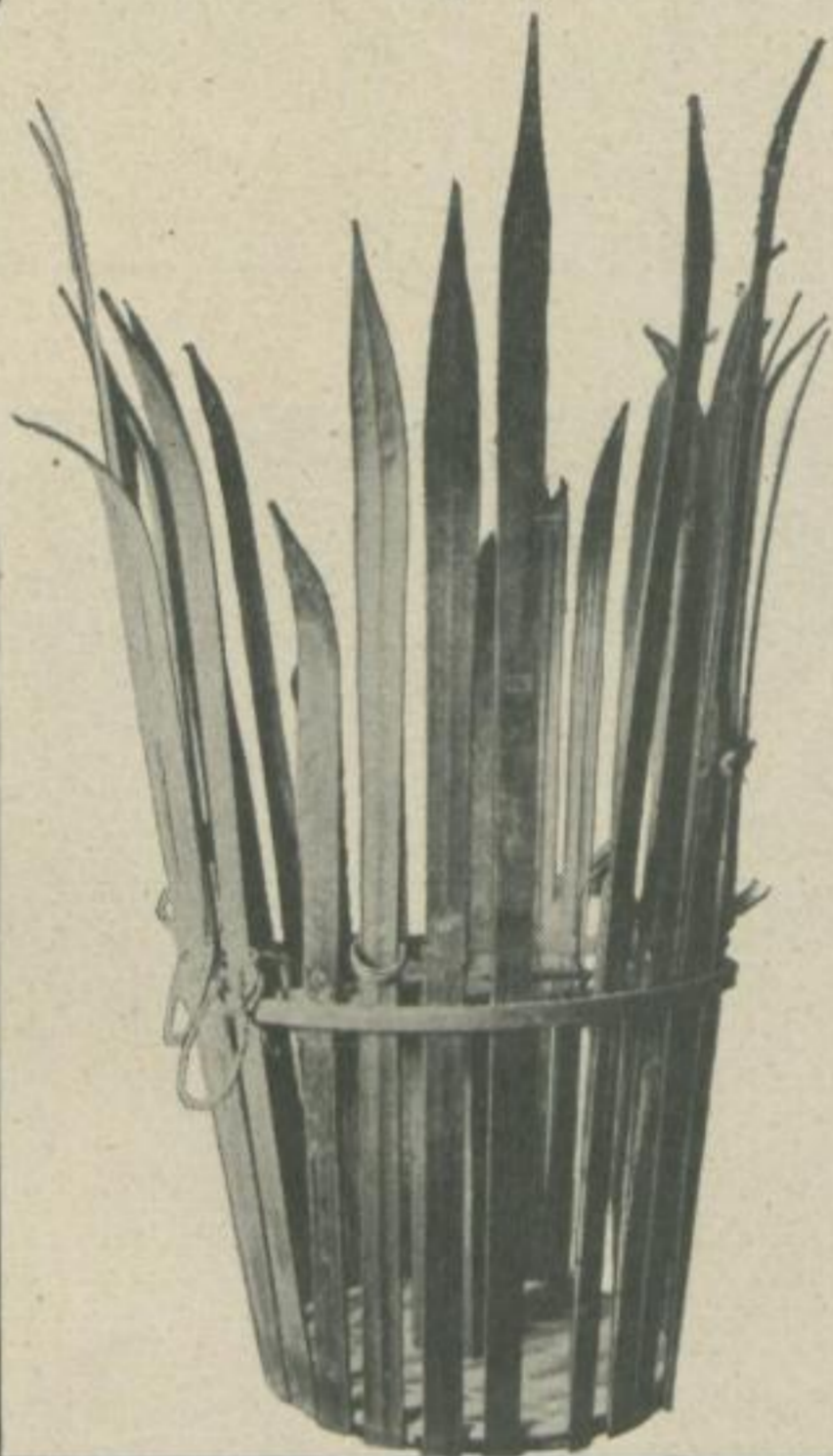
Schneeschuhe aus allen Weltgegenden

enthüllt werden können. Als einigermaßen sicher kann man aber annehmen, daß sein Alter wohl an die 3000 Jahre erreicht. Die Heimat des Schneeschuhs ist überall da, wo schneereiche Winter die Notwendigkeit dieses Hilfsmittels zur Fortbewegung bedingen. Uralte Runensteine, Aufzeichnungen und sonstige Nachlässe der Frühgeschichte zeigen uns, daß der Skilauf in vielen Ländern der Erde bereits in frühester Zeit heimisch war. Sehr interessant berichten die Annalen der Tang-Dynastie im Tang-