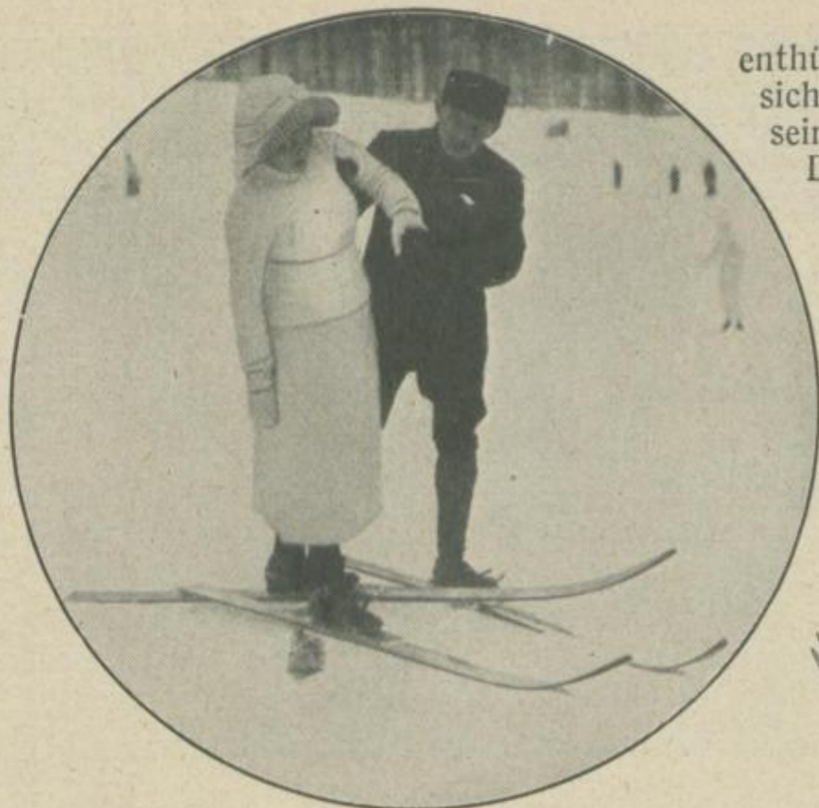
Erste Versuche der Skifahrerin um 1912

enthüllt werden können. Als einigermaßen sicher kann man aber annehmen, daß sein Alter wohl an die 3000 Jahre erreicht. Die Heimat des Schneeschuhs ist überall da, wo schneereiche Winter die Notwendigkeit dieses Hilfsmittels zur Fortbewegung bedingen. Uralte Runensteine, Aufzeichnungen und sonstige Nachlässe der Frühgeschichte zeigen uns, daß der Skilauf in vielen Ländern der Erde bereits in frühester Zeit heimisch war. Sehr interessant berichten die Annalen der Tang-Dynastie im Tang-