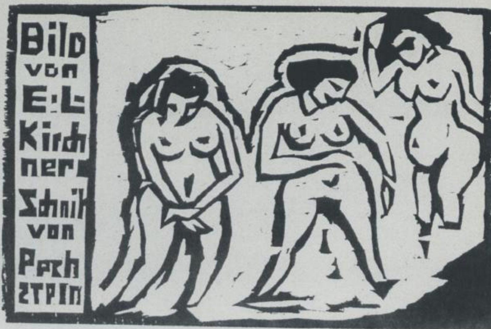
Max Pechstein, Drei Badende, Holzschnitt 1910 (nach einem Bild von E. L. Kirchner)