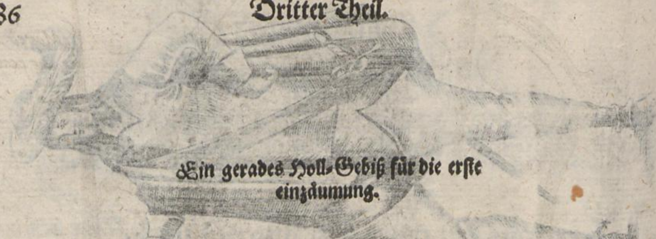
Ein gerades Holl-Gebiß für die erste einzäumung.