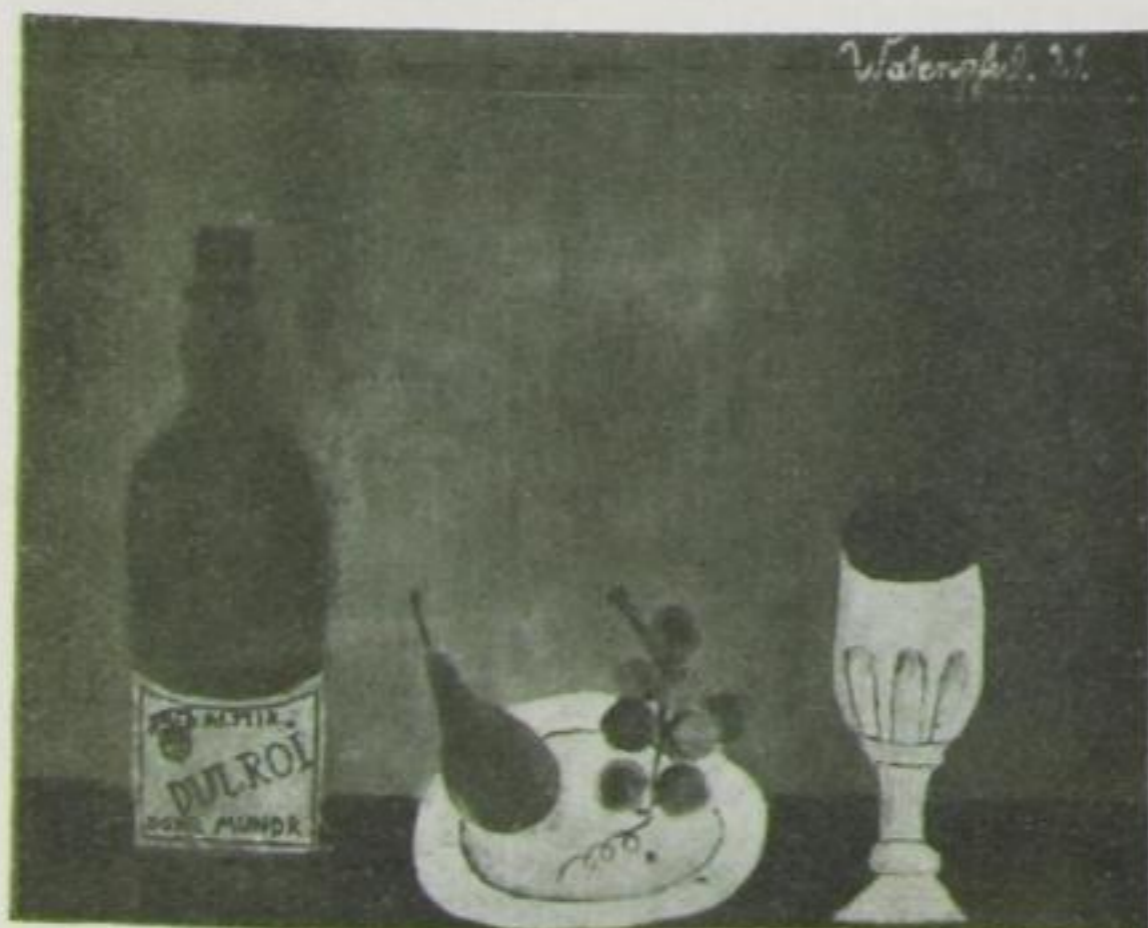
MAX P. WATERPHUL Stilleben (Oel) (ausgestellt in Essen, Goldschmidthaus)

eine bauende werden. Wenn der junge Mensch, der Liebe zur bildnerischen Tätigkeit in sich verspürt, wieder wie einst seine Bahn