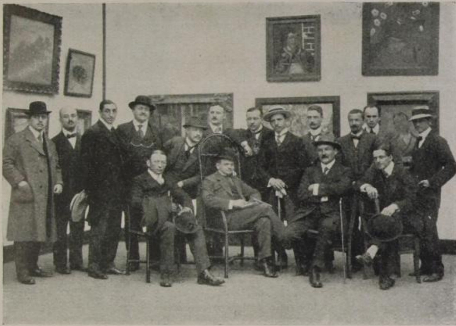
Der Vorstand der Sonderbund-Ausstellung Köln 1912