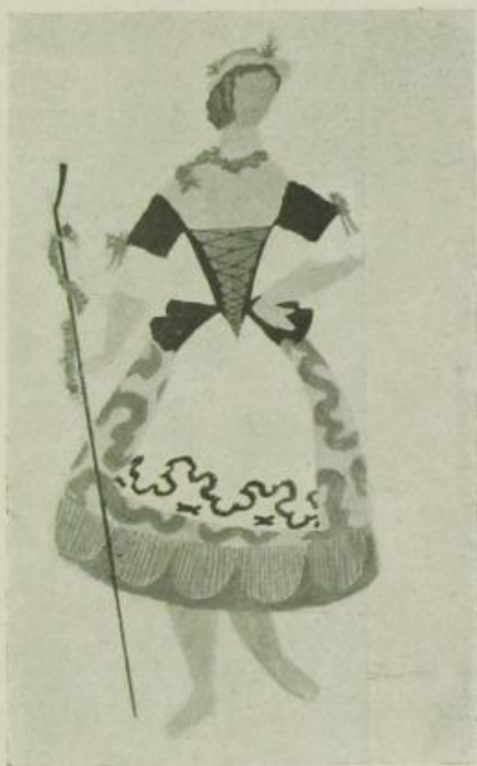
Leo Zack (Paris) Kostüm für „Die Maikönigin“ (Russisches Romantisches Theater)