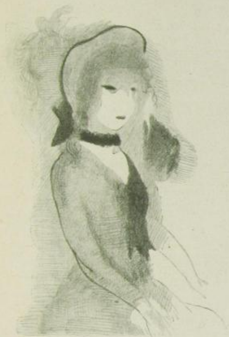
Marie Laurencin Catherine (Litho) 1922