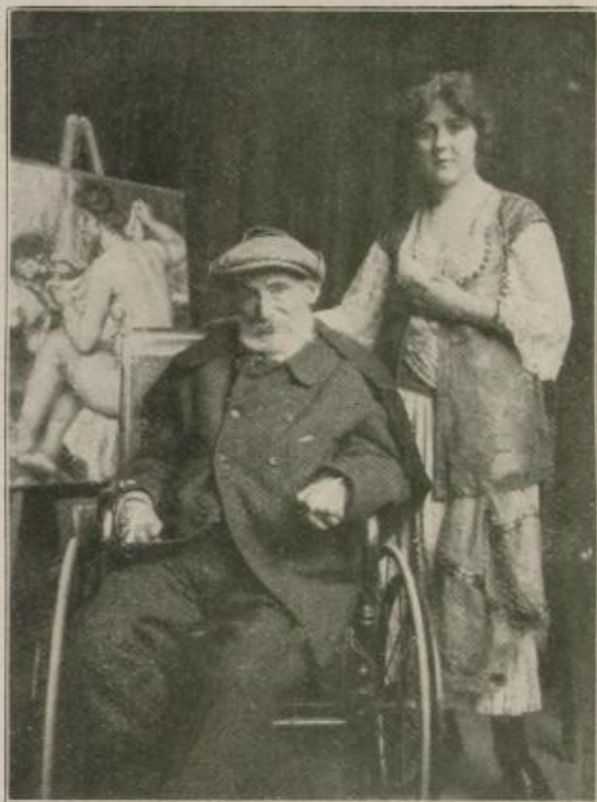
Renoir und sein Modell Letzte Aufnahme

Aus den Eröffnungsausstellungen der Galerie Flechtheim bei Würthle in Wien