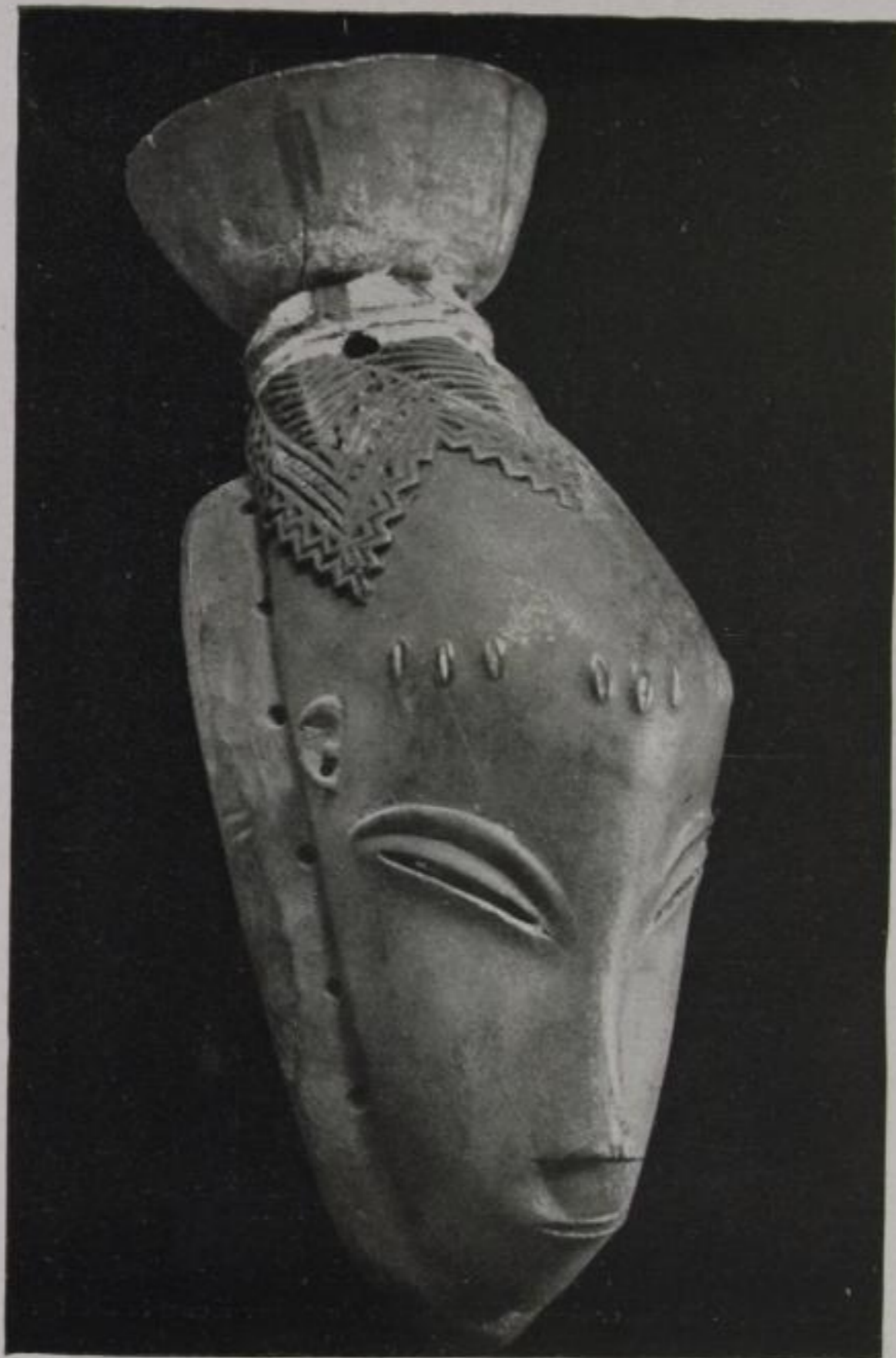
Kopf aus Gabon (Sammlung Paul Guillaume)