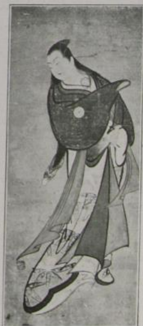
Moramassa (Schüler des Moronobu) um 1700