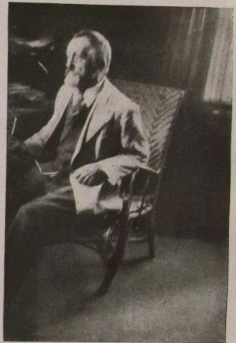
Christian Rohlf im Folkwang zu Hagen 1922