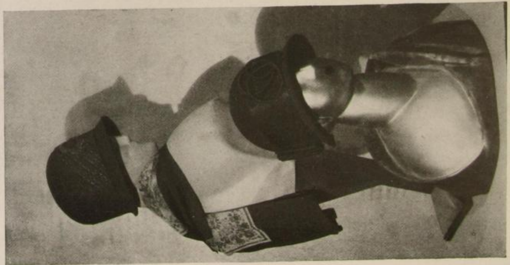
Neue Modeplastiken für Hüte, Kleider, Handschuhe von André Vigneau, Paris