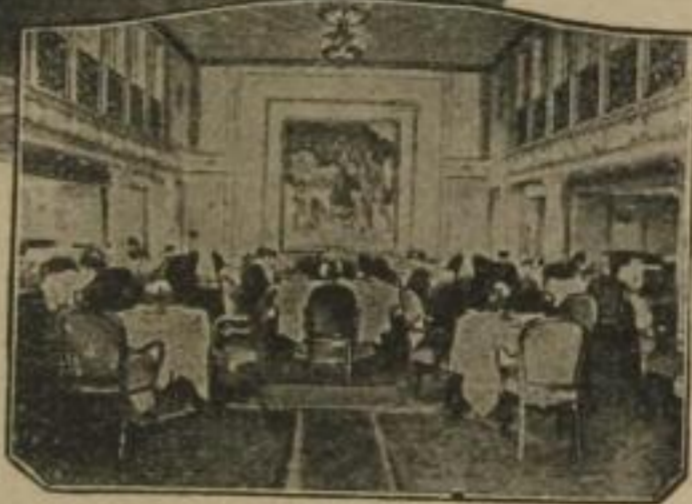
(Speisesaal 1. Klasse D. Deutschland)

werden die Dampfer „Albert Ballin“, „Deutschland“, „Resolute“ und „Reliance“ vorzugsweise benutzt. Größte Wohnlichkeit und künstlerisch vornehme Ausgestaltung der Passagierräume, verbunden mit höchster Sicherheit und dem bekannt ruhigen Gang dieser Dampfer, verbürgen eine Reihe sorgloser Tage / Ausgezeichnete Verpflegung und sorgfältige Bedienung der Reisenden in allen Klassen haben diese Dampfer beim Publikum außerordentlich beliebt gemacht / Den Reisenden aller Klassen steht eine ausgewählte Bibliothek zur Verfügung, ebenso ist für Unterhaltung und Zerstreuung aufs beste gesorgt. Alles Nähere aus den reich illustr. Prospekten ersichtlich / Abfahrten ca. alle 5 Tage / Auskünfte u. Drucksachen durch