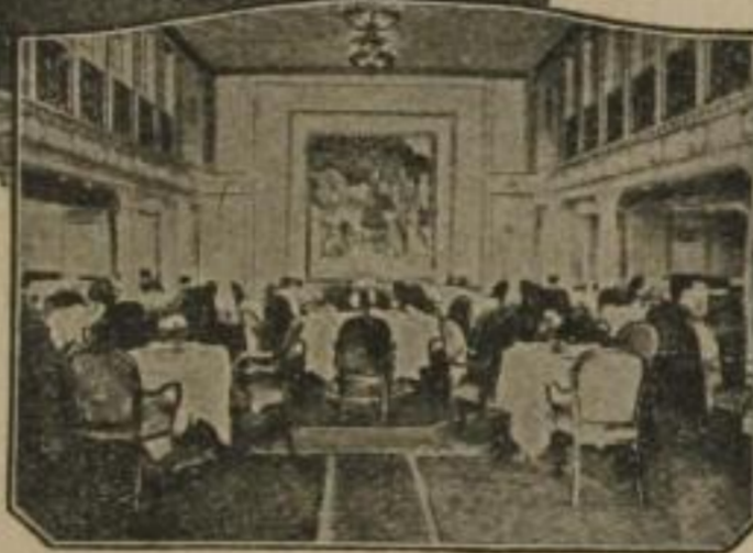
(Speiseraal 1. Klasse D. Deutschland)

werden die Dampfer „Albert Ballin“, „Deutschland“, „Resolute“ und „Reliance“ vorzugsweise benutzt. Größte Wohnlichkeit und künstlerisch vornehme Ausgestaltung der Passagierräume, verbunden mit höchster Sicherheit und dem bekannt ruhigen Gang dieser Dampfer, verbürgen eine Reihe sorgloser Tage / Ausgezeichnete Verpflegung und sorgfältige Bedienung der Reisenden in allen Klassen haben diese Dampfer beim Publikum außerordentlich beliebt gemacht / Den Reisenden aller Klassen steht eine ausgewählte Bibliothek zur Verfügung, ebenso ist für Unterhaltung und Zerstreuung aufs beste gesorgt. Alles Nähere aus den reich illustr. Prospekten ersichtlich / Abfahrten ca. alle 5 Tage / Auskünfte u. Drucksachen durch