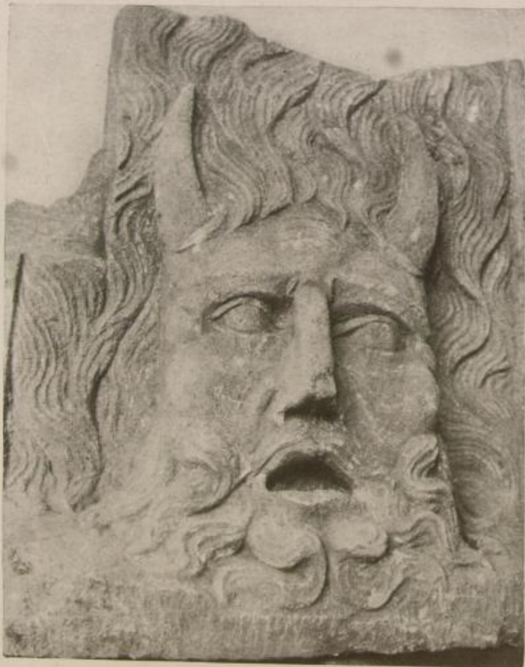
Bonn, Provinzial-Museum „Der Vater Rhein“, Römisches Relief eines Flußgottes