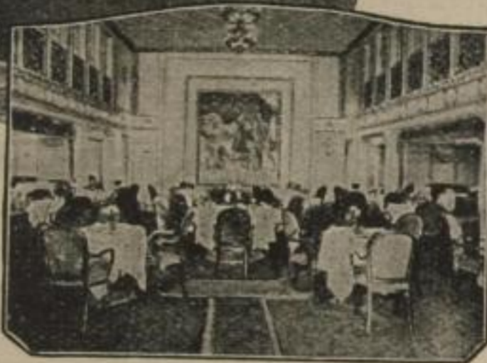
(Speisesaal 1. Klasse D. Deutschland)

werden die Dampfer „Albert Ballin“, „Deutschland“, „Resolute“ und „Reliance“ vorzugsweise benutzt. Größte Wohnlichkeit und künstlerisch vornehme Ausgestaltung der Passagierräume, verbunden mit höchster Sicherheit und dem bekannt ruhigen Gang dieser Dampfer, verbürgen eine Reihe sorgloser Tage / Ausgezeichnete Verpflegung und sorgfältige Bedienung der Reisenden in allen Klassen haben diese Dampfer beim Publikum außerordentlich beliebt gemacht / Den Reisenden aller Klassen steht eine ausgewählte Bibliothek zur Verfügung, ebenso ist für Unterhaltung und Zerstreuung aufs beste gesorgt. Alles Nähere aus den reich illustr. Prospekten ersichtlich / Abfahrten ca. alle 5 Tage / Auskünfte u. Drucksachen durch