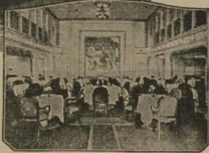
(Speiseaal 1. Klasse D. Deutschland)

werden die Dampfer „Albert Ballin“, „Deutschland“, „Resolute“ und „Reliance“ vorzugsweise benutzt. Größte Wohnlichkeit und künstlerisch vornehme Ausgestaltung der Passagierräume, verbunden mit höchster Sicherheit und dem bekannt ruhigen Gang dieser Dampfer, verbürgen eine Reihe sorgloser Tage / Ausgezeichnete Verpflegung und sorgfältige Bedienung der Reisenden in allen Klassen haben diese Dampfer beim Publikum außerordentlich beliebt gemacht / Den Reisenden aller Klassen steht eine ausgewählte Bibliothek zur Verfügung, ebenso ist für Unterhaltung und Zerstreuung aufs beste gesorgt. Alles Nähere aus den reich illustr. Prospekten ersichtlich / Abfahrten ca. alle 5 Tage / Auskünfte u. Drucksachen durch