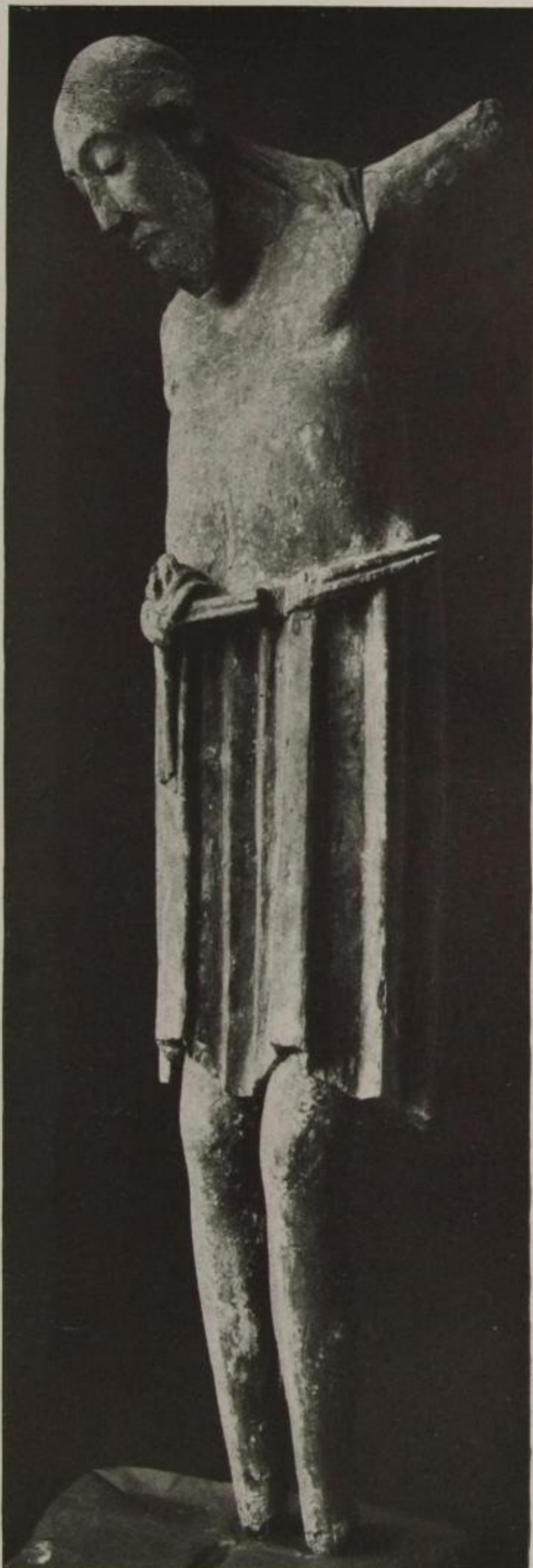
Köln, Kunstgewerbemuseum Kruzifixus aus St. Jakob