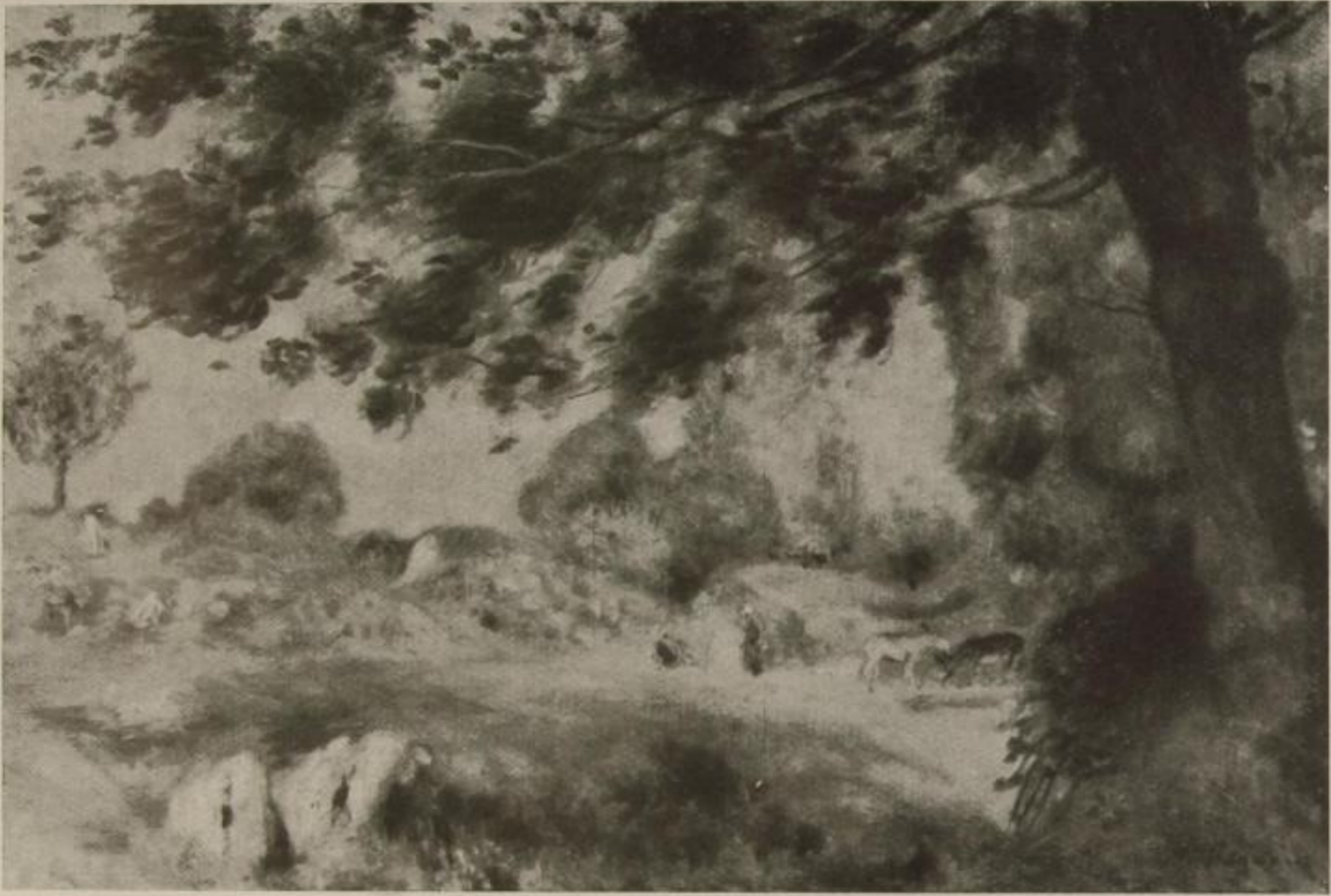
Auguste Renoir, Landschaft bei Cagnes