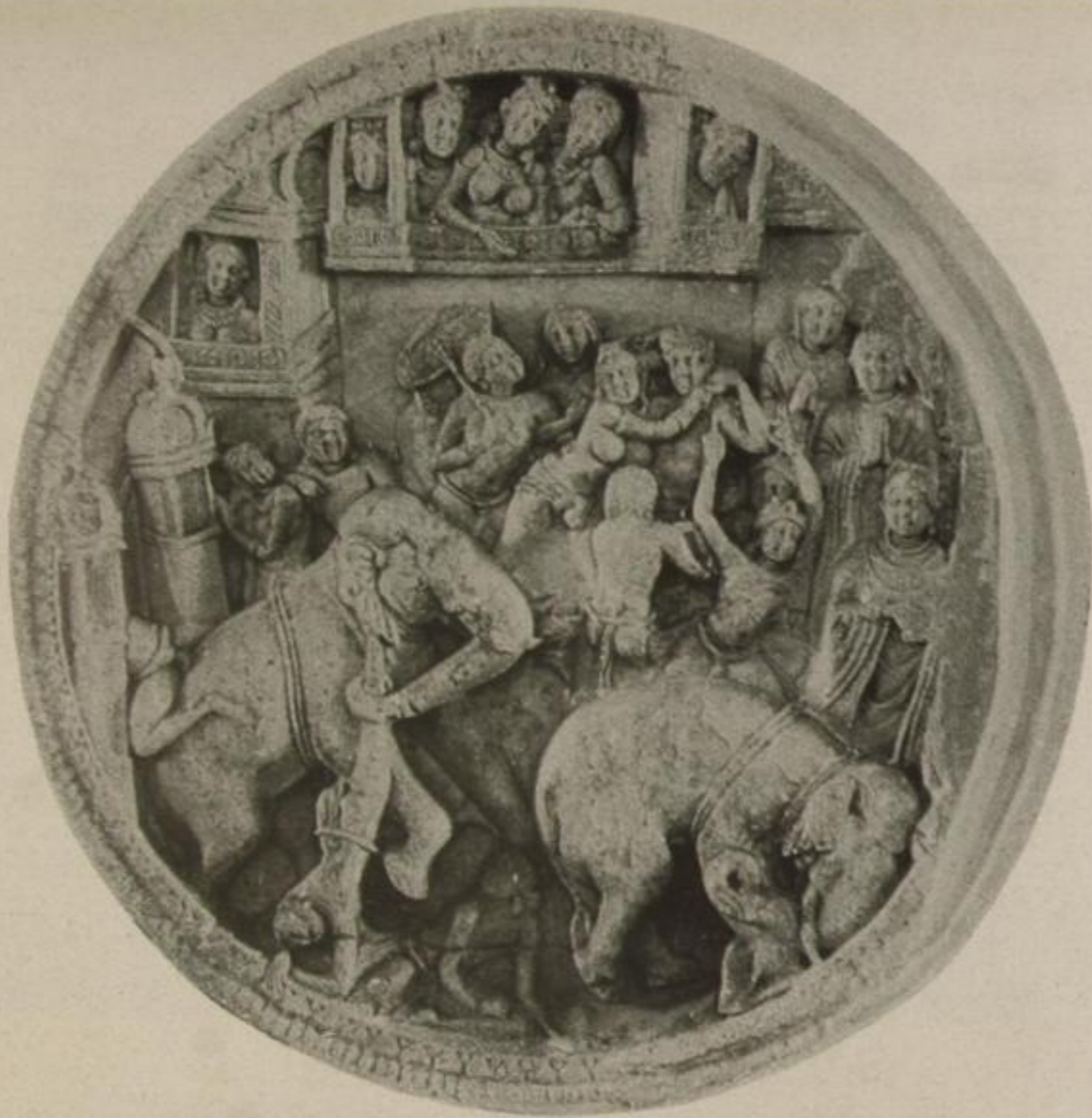
Buddha bändigt den wilden Elefanten mit einem Strahl seiner Wesensliebe. Relief 2. Jahrh. n. Chr. Amaravati