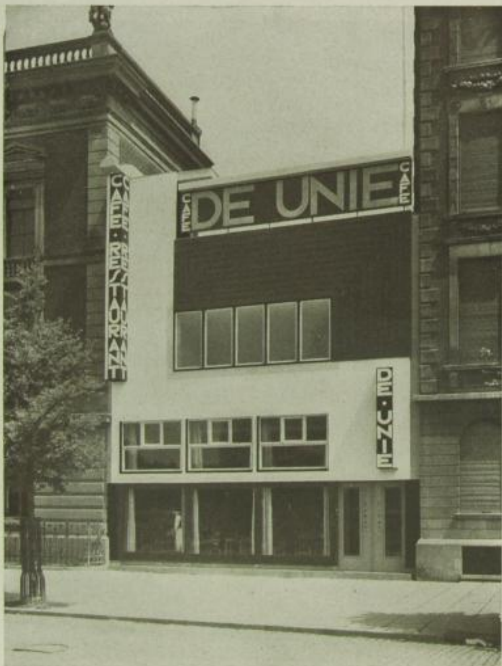
J. J. P. Oud, Das Café „De Unie“ in Rotterdam