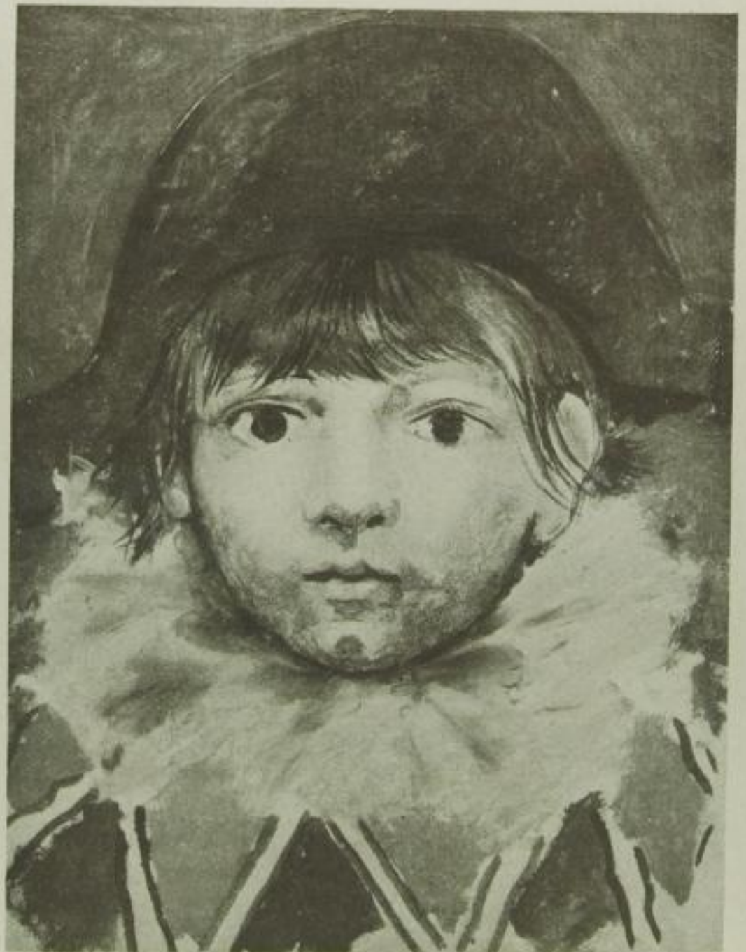
Picasso, Sein Sohn Paul. Ölgemälde. Im Besitz des Künstlers