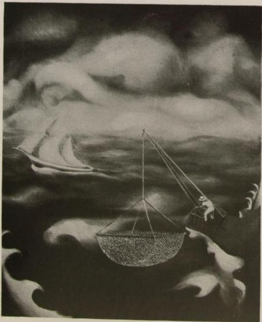
Elje Lascaux, Fischfang. Oelgemälde Bielefeld, Slg. Willi Katz