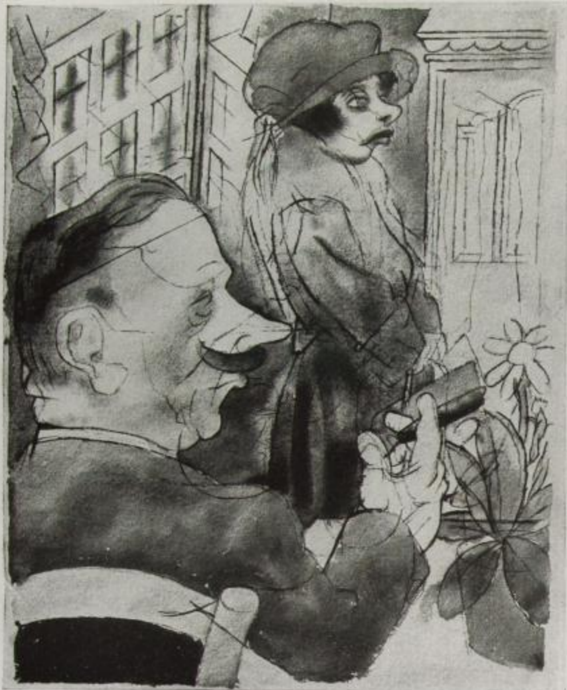
Ausstellung Bruno Cassirer George Groß, Vater und Tochter. Aquarell