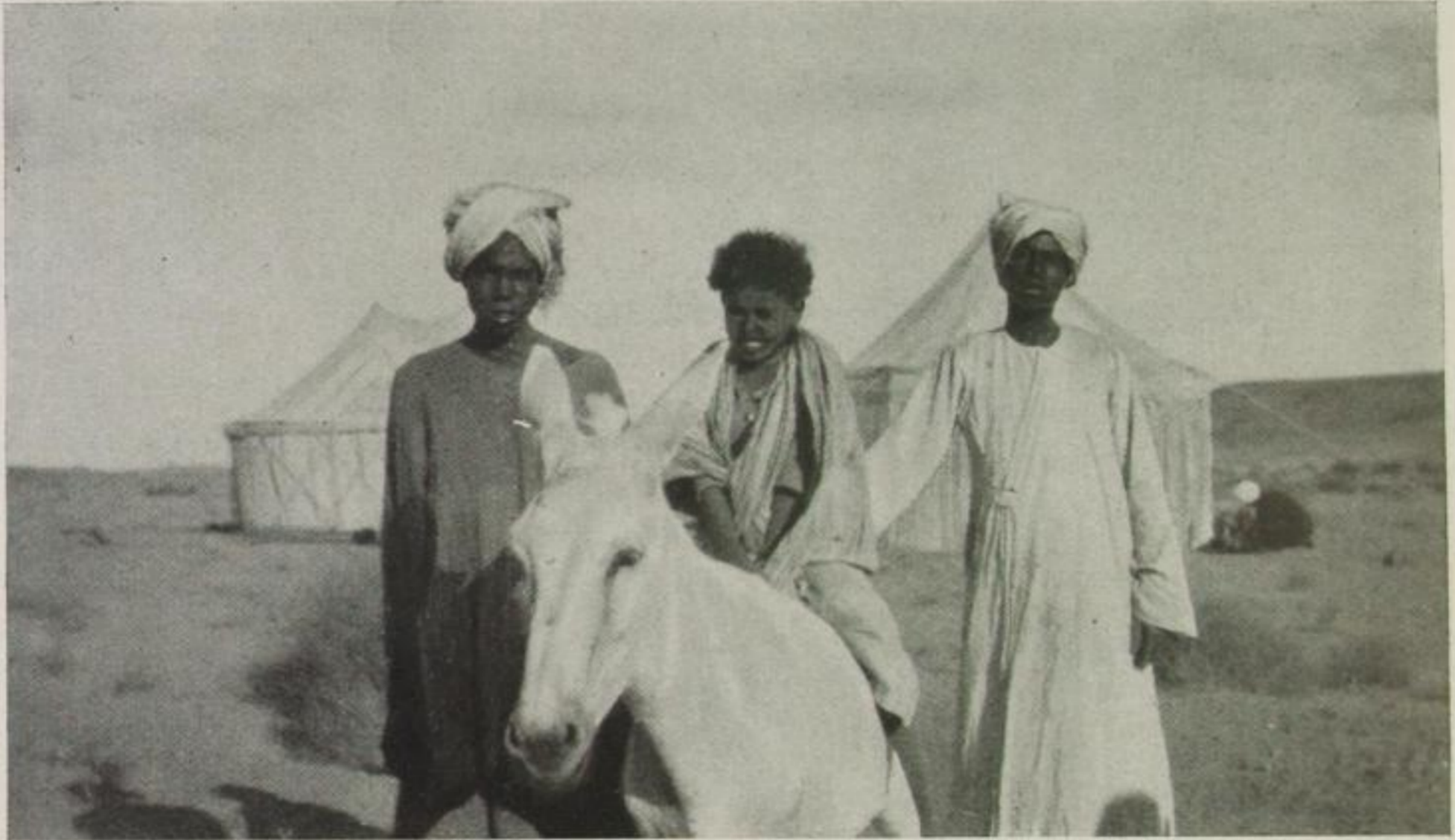
Fellachen in der Wüste