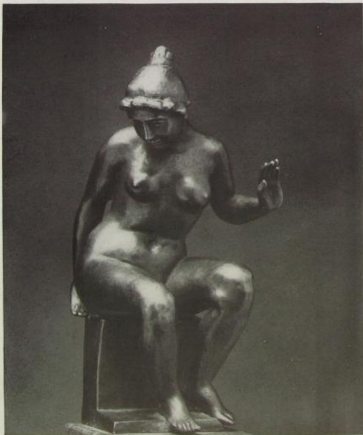
Leihgabe der Galerie Flechtheim Aristide Maillol, Abwehrende. Bronze in der Darmstädter Ausstellung „Der Schöne Mensch“