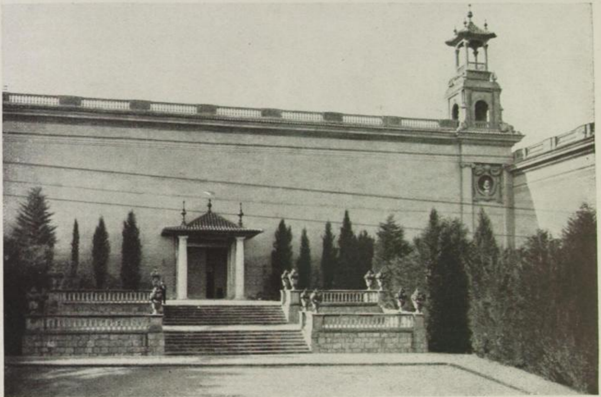
Der Palast Alfons XIII.